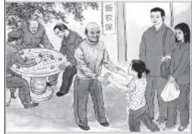
帮父母参加新农合新农保