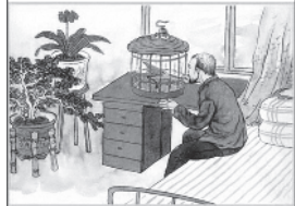
让父母居住安全舒适