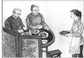
保障父母衣食无忧