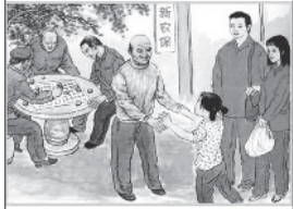
帮父母参加新农合新农保