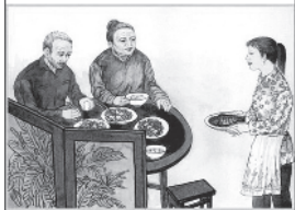
保障父母衣食无忧