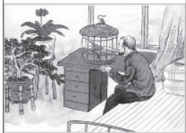
让父母居住安全舒适