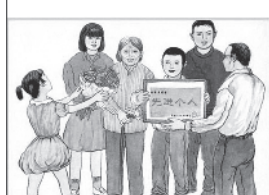
向父母多报喜少报忧