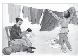
尽量与父母共同生活