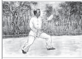
帮父母养成良好生活习惯