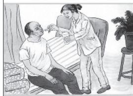
照顾好高龄、失能父母起居