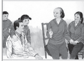
家事多听父母意见