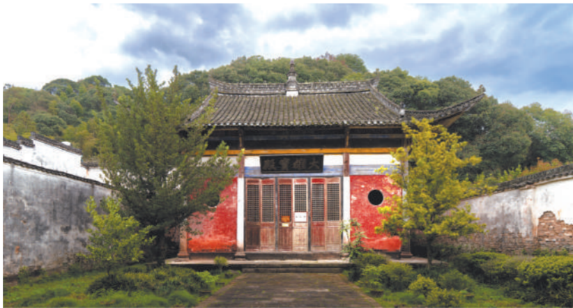
丛林寺大雄宝殿外观