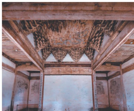
丛林寺大雄宝殿内情景