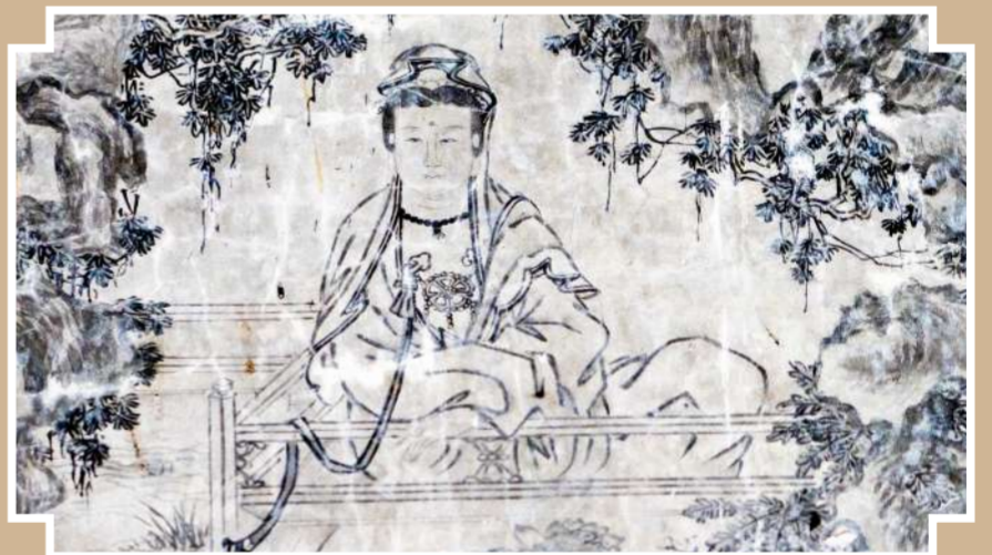
以上为部分水墨观音壁画