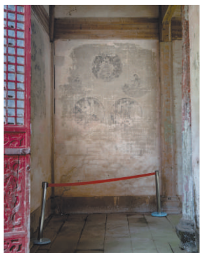
壁画存在现场环境