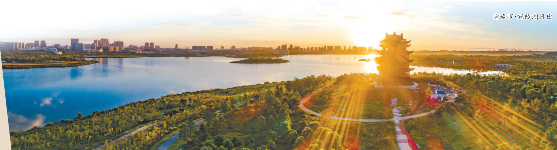
宣城市·宛陵湖日出

征程万里风正劲，重任千钧再奋蹄。从“文旅大市”到“文旅强市”，宣城正以坚实的步伐逐梦前行。未来，这座“宣纸上的山水画卷”，将以更美的风景、更优的服务、更浓的文化，吸引天下游客前来打卡，书写文旅融合发展的新篇章。