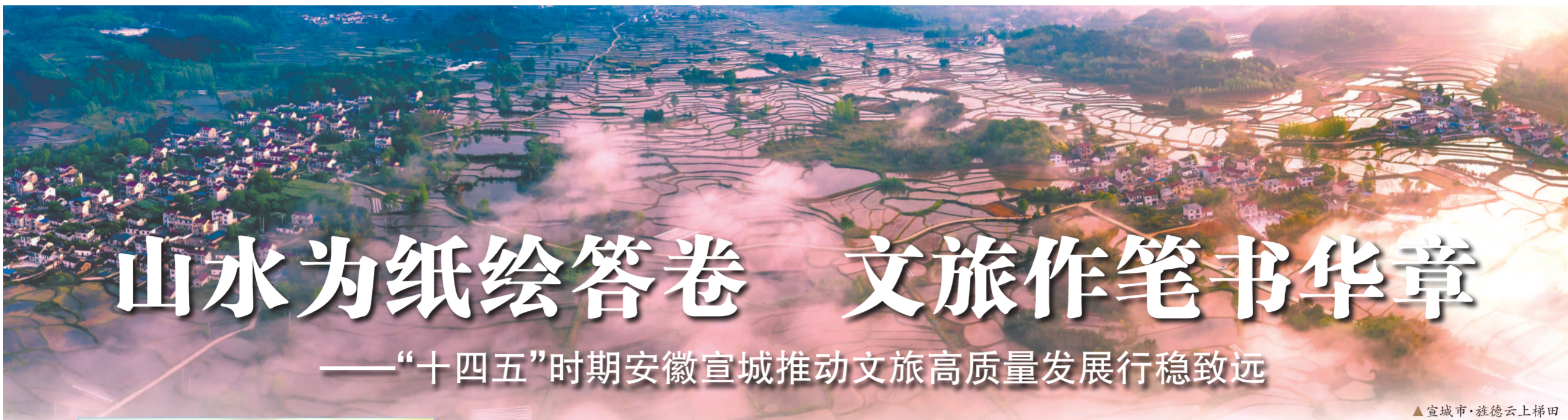
▲宣城市·旌德云上梯田