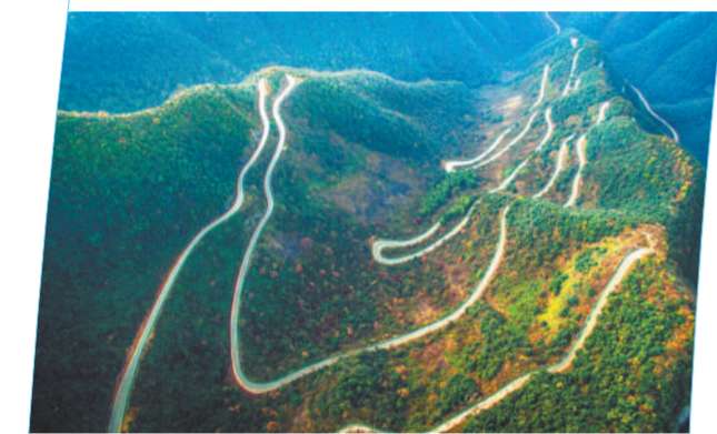
▲宣城市·皖南川藏线桃岭六道湾