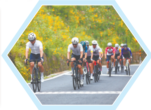
▲宣城市·绩溪皖浙天路kom挑战赛

“皖南川藏线”入选“中国体育旅游十佳精品线路”、“2024年十大最美自驾游”；广德、绩溪、泾县、宁国相继创成省级全域旅游示范区；水东古镇、箬竹庄园创成国家4A级旅游景区，全市景区矩阵实现质量齐升；71家“皖美民宿”点缀山水之间，泾县入选“十大皖美民宿集聚区”……这一系列亮眼成果，生动绘就了“十四五”时期安徽省宣城市文化和旅游业蓬勃发展的壮丽画卷。 五年来，宣城市紧抓长三角一体化发展、皖南国际文化旅游示范区建设等战略机遇，坚持以全域旅游为引领、文旅融合为路径，在产业布局、产品供给、基础设施、服务质量等方面实现跨越式发展，成功将文旅资源优势转化为发展优势，持续擦亮“宣纸上的山水画卷”金字招牌，高质量旅游强市建设迈出坚实步伐、站上新的历史台阶。