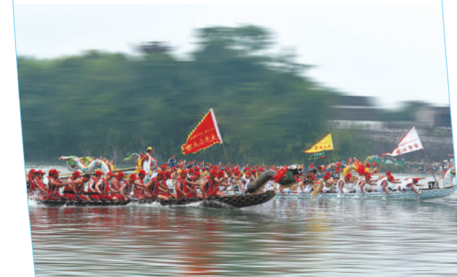
▲宣城市·泾县桃花潭