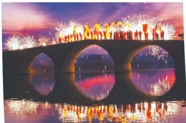
▲宣城市·郎溪鱼化龙灯