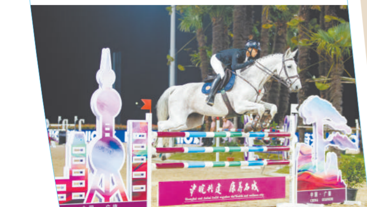
▲宣城市·国际马联CSI国际马术场地障碍赛

“皖南川藏线”入选“中国体育旅游十佳精品线路”、“2024年十大最美自驾游”；广德、绩溪、泾县、宁国相继创成省级全域旅游示范区；水东古镇、箬竹庄园创成国家4A级旅游景区，全市景区矩阵实现质量齐升；71家“皖美民宿”点缀山水之间，泾县入选“十大皖美民宿集聚区”……这一系列亮眼成果，生动绘就了“十四五”时期安徽省宣城市文化和旅游业蓬勃发展的壮丽画卷。 五年来，宣城市紧抓长三角一体化发展、皖南国际文化旅游示范区建设等战略机遇，坚持以全域旅游为引领、文旅融合为路径，在产业布局、产品供给、基础设施、服务质量等方面实现跨越式发展，成功将文旅资源优势转化为发展优势，持续擦亮“宣纸上的山水画卷”金字招牌，高质量旅游强市建设迈出坚实步伐、站上新的历史台阶。