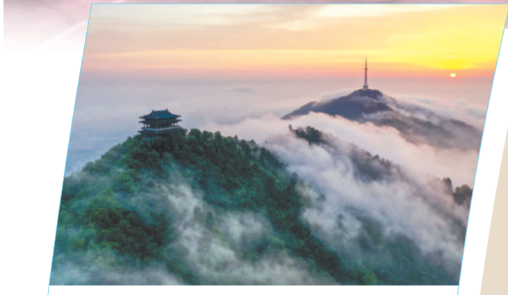
▲宣城市·敬亭山日出云海