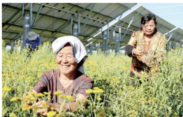
庆祝中药材种植专业合作社流转土地1300亩种植旋覆花等中药材,带动200多户村民通过土地流转、基地务工等方式实现增收。

聚力产业兴镇,夯实发展根基 口孜镇坚持发展第一要务,积极谋划项目,全力争取资金,推动项目早落地、早见效。不折不扣落实惠企政策,着力优化营商环境,支持实体经济发展,精心培育涵养税源。立足本土资源,大力发展牛羊养殖加工、中药材生产等特色农业,积极培育农村产业带头人。推动农业技术更新,发展设施农业与高效农业。同时,探索盘活集体资产,创新合作经营模式,持续壮大村集体经济,为镇域经济高质量发展注入强劲动力。