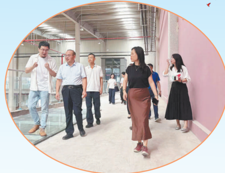
中行阜阳分行与企业家交流

踏上“十五五”新征程,中行阜阳分行将继续坚守服务实体经济初心,以更大的力度、更实的举措、更优的服务,全力融入阜阳经济社会发展大局,奋力书写高质量发展的新篇章。