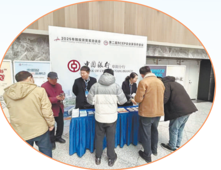
2025年阜洽会宣传活动

在阜阳市颍东区的东南部,坐落着一个充满活力与潜力的乡镇——口孜镇。这里交通便利,民风淳朴,资源丰富,既是传统的农业大镇,也正焕发着产业升级、乡村振兴的崭新气象。近年来,口孜镇立足实际,凝心聚力,围绕高质量发展目标,统筹推进各项事业,一幅产业兴旺、生态宜居、乡风文明、治理有效、生活富裕的美丽画卷正在徐徐展开。