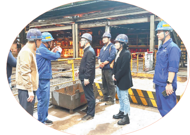
市政协侨联界别委员在芜湖新兴铸管有限责任公司调研