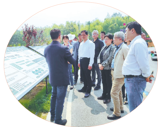
市政协特邀界别委员围绕“商农旅融合发展与乡村振兴”主题开展调研

市政协教育界别将持续发挥界别所能、委员所长,围绕加大政策优待、多措并举,不断优化师资结构,持续培育高素质育人队伍;完善特殊教育体系,不断延伸基础教育到职业教育的特殊教育发展路