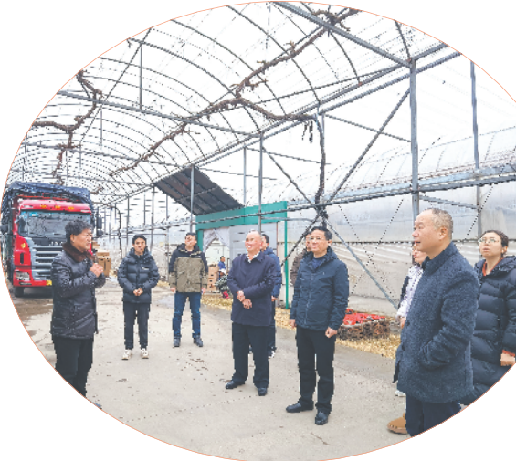
繁昌区政协组织各镇经开区政协委员召集人调研乡村振兴工作