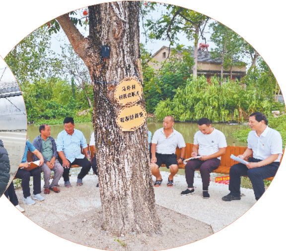
鸠江区政协开展“协商在村居”活动