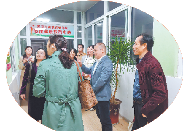
市政协医药卫生界别联合妇联、教育界别部分委员赴南瑞实验学校开展实地调研活动