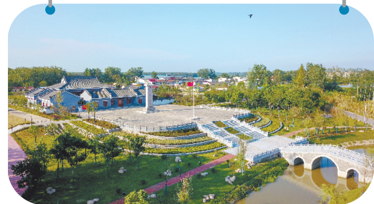
造甲乡中共合肥北乡支部纪念馆