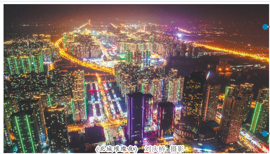
《北城璀璨夜》