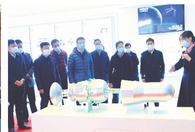
省药监局党组理论学习中心组全体成员组织参观安徽省创新中心。