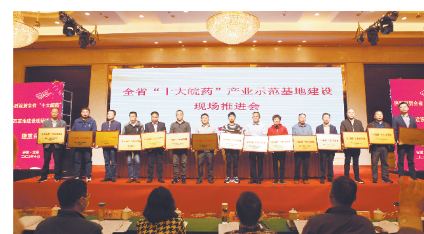
在全省县银行“十大皖药”产业基地授牌。