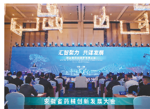
以“汇智聚力,共谋发展”为主题的安徽省药械创新发展大会在合肥市召开。