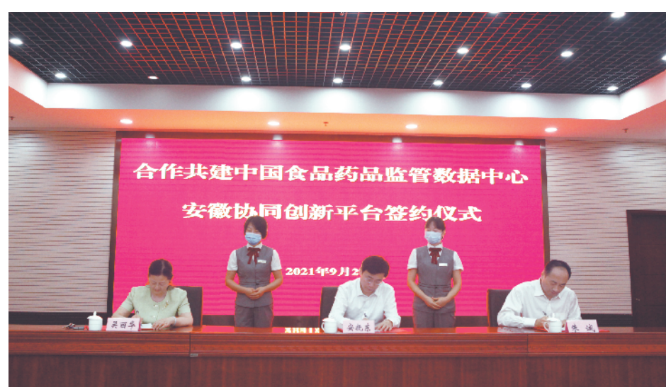
国家药品监督管理局信息中心、安徽省药品监督管理局、安徽省数据资源管理局举行合作共建中国食品药品监管数据中心的签约仪式,正式开启药品数据合作的新篇章。