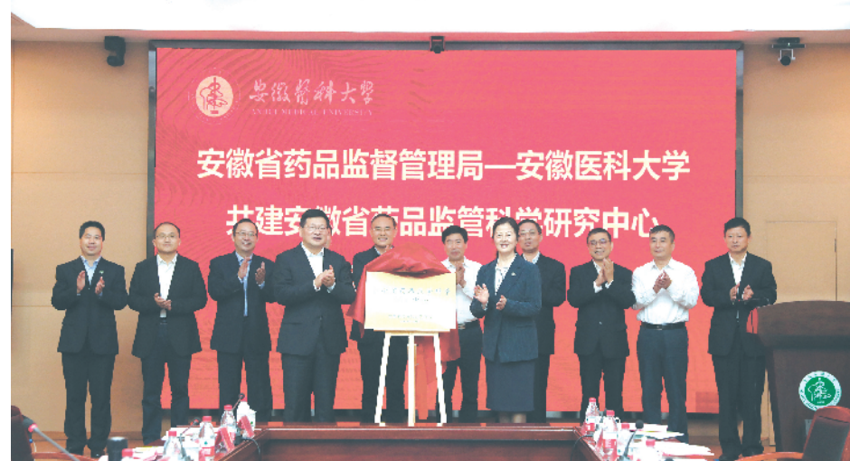
省药监局与安徽医科大学举行共建安徽省药品监管科学研究中心签约仪式。