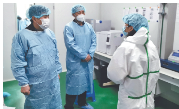
省药监局副局长许俊新到合肥美迪普医疗用品有限公司调研,督促企业严格落实《医疗器械生产质量管理规范》要求。