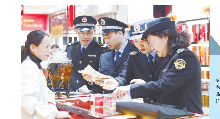
在药品安全春风行动中开展药品流通环节检查。

一是强化平台思维,促进要素资源互动耦合。以打造资源整合平台为重点,先后成功举办首届“安徽省中药创新发展大会”“2021药品数智发展大会”“安徽省药械创新发展大会”3场盛会,汇聚行政机关、产业园区、药械企业、高校院所、医疗机构、行业协会、第三方服务及投资机构等各方力量,将创新意识培养、创新能力培训、创新成果展示、推进“双招双引”与平台搭建有机结合,实现“政产学研用金”合作交流、融合融通、协同创新,平台乘数效应突显,“双招双引”成效突出,初步达成来皖投资、合作意向22个,拟投资金额近300亿元。2021年,全省签约医药产业项目256个,已开工项目(含完成)77个,到位资金92.6亿元。王清宪省长先后2次对我局搭建平台、整合资源的做法作出批示,给予高度肯定并加以推广。同时,进一步丰富拓展平台形式,加快推进医疗器械领域创新大赛、企业家沙龙等平台建设。二是强化差异化思维,推动医药产业错位发展。从全国层面,瞄准我省特色中药产业发展“堵点”,创新方法举措,出台《关于促进中药传承创新发展若干措施》等多项政策举措,成功申报我省首家国家药监局中药质量研究与评价重点实验室,规范产地趁鲜切制中药材管理,打响“十大皖药”品牌,指导亳州市在全国率先探索中药饮片信息化追溯体系建设,推动我省由“中药大省”向“中药强省”迈进。从全省层面,根据各地差异化需求,建立医药创新服务多样性工作站,共建药械检验检测实验室,申报我省首个药品进出口岸等多种方式,推动各地医药产业错位发展,增强“双招双引”吸引力。三是强化规模化思维,服务医药产业聚集发展。综合采取政策指导、合作共建、试点先行、建议咨询等方式,助力合肥、亳州、阜阳、滁州、黄山等地打造生命健康产业群。专班服务亳州打造“世界中医药之都”的有关做法及成效获王清宪省长批示高度肯定。分别与黄山、滁州市政府签订合作协议,共同推进当地医药产业发展。服务医药产业聚集发展相关工作受到当地政府和药械企业广泛好评。