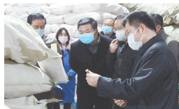
省药监局副局长张强、张磊赴亳州市督查指导中药饮片生产质量管理工作的。