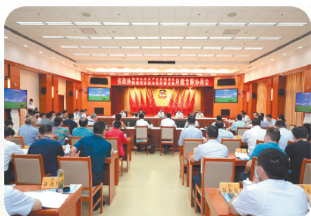
召开“加快优质农产品基地建设,助推我省农业高质量发展”月度专题协商会