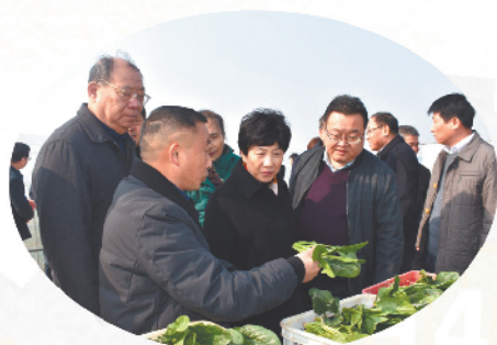
肖超英副主席率队赴望江县开展“我为群众办实事”实践活动

2021年,省政协农业和农村委员会聚焦实现巩固拓展脱贫攻坚成果同乡村振兴有效衔接,认真履职,开拓创新,取得良好实效。精心承办“加快优质农产品基地建设,助推我省农业高质量发展”月度专题协商会,会议形成的建议获时任省委书记李锦斌和省长王清宪等4位省委省政府领导批示肯定。聚焦“发展乡村旅游、助推乡村振兴”主题组织召开对口协商会,形成的建议获省政府负责同志批示,“十四五”乡村旅游发展规划中吸纳了相关建议内容。围绕“深入推进农村厕所革命”课题组织开展联动调研和民主监督,形成的报告得到全国政协的充分肯定。持续打造“搭建我省现代农业产业化龙头企业发展咨询服务平台”特色工作品牌,积极组织委员开展调研、界别活动、委员读书及委员小组活动等,为助力我省“三农”工作贡献智慧和力量。