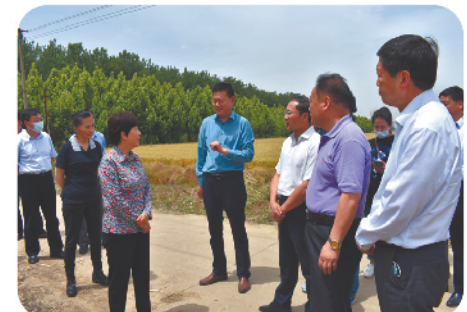
在蚌埠开展线下读书活动并开展月度专题协商会调研