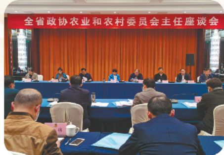
在宿州召开全省政协农业和农村委员会主任座谈会