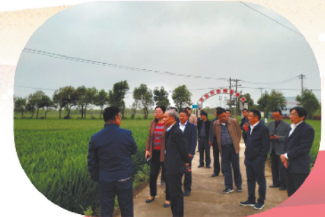
农业界委员赴阜阳调研农产品基地建设情况