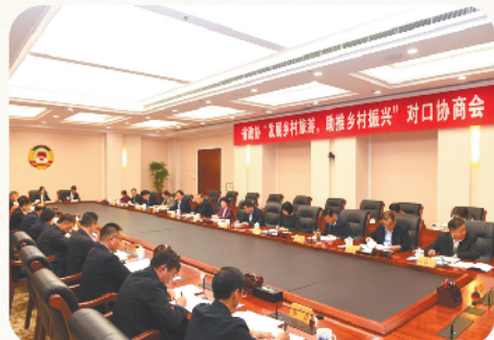
召开“发展乡村旅游,助推乡村振兴”对口协商会