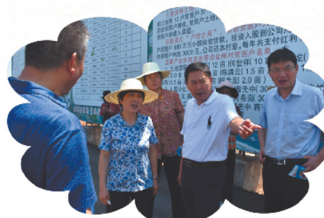
在安庆市怀宁县开展“四级委员在行动”专项民主监督调研