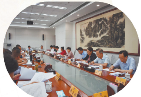
召开农产品基地和龙头企业负责人座谈会