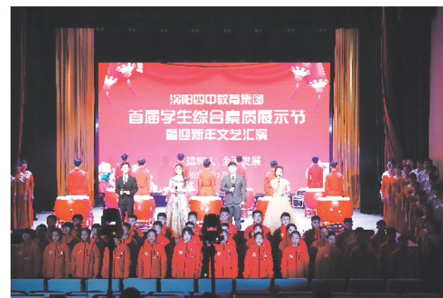
首届学生综合素质展示节

涡阳县马店集镇卫生院创建于1970年,集预防保健、医疗为一体,肩负着辖区15个行政村约六万人的医疗保障和基本公共卫生服务的重任。该院以绩效考核为抓手,狠抓党建工作,促进队伍建设,夯实技术根基,全力助推管理水平,提升医疗服务层次。 为民守护,不忘初心。卫生院坚持“科技兴院,质量建院,人才强院”的理念,先后与淮北矿工医院、涡阳县中医院等展开深入合作,打造医共体的强强联合。如今,卫生院已有本科学历