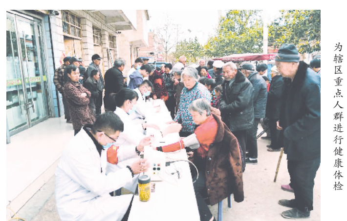
为辖区重点人群进行健康体检

环境消杀、对疫区返回人员进行流调,共为通过大数据比对的武汉返乡人员做核酸检测385人次,辖区15个村室人员全部参与为返乡居家隔离人员进行医学观察,测量体温3000多人次,受到社会各界人士的一致赞扬。 经过翻天覆地的变化,卫生院取得一项项骄人成绩:先后获得安徽省“优质服务基层行”达标单位;2019年获得中医院医共体综合评比一等奖;被亳州市总工会、亳州市扶贫开发局评为先进集体。