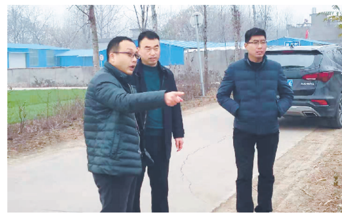
星园街道蔡主任督查人居环境整治