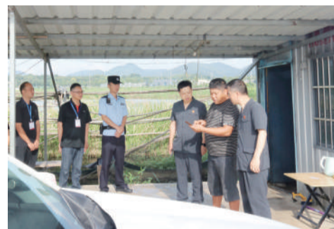
今年7月30日,代表委员跟随繁昌区人民法院执行干警在被执行人鱼塘了解小龙虾养殖情况,见证被执行人当场通过移动支付方式偿还首期欠款。

面对复杂执行案件,既保持执行力度,又体现人文关怀;既确保债权实现,又关注被执行人生存发展;既运用强制措施,又注重疏导化解。在安徽