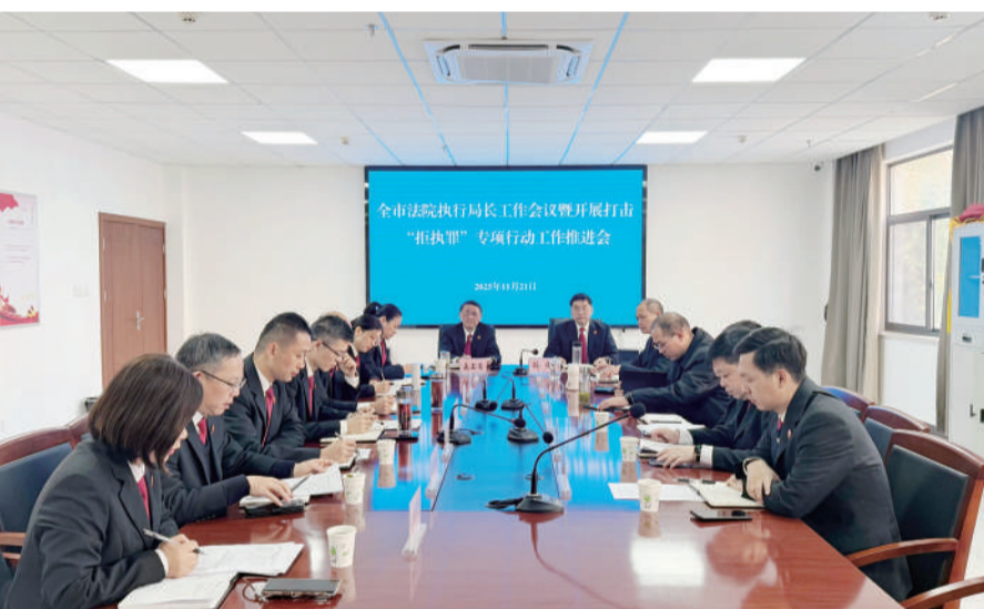
11月21日,芜湖市中级人民法院召开全市法院执行局长工作会议暨开展打击“拒执罪”专项行动工作推进会。

立足新阶段,芜湖法院将始终秉持司法为民理念,持续深化执行工作机制创新,通过进一步健全联动协作体系,完善智慧执行模式,优化刚柔并济举措,不断提升执行工作质效,让公平正义以更高效率、更具温度的方式得以实现,为芜湖加快打造省域副中心、建设人民城市提供更加坚实的法治保障。(张安云)