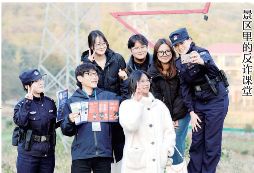
景区里的反诈课堂

主动延伸服务触角,前往辖区纸鸢香草庄园,为前来参观游览的同学们送上一场反诈安全知识宣讲活动。民警从典型案例切入,用通俗易懂的语言拆解刷单返利、校园贷等诈骗手法,让同学们在放松心情、欣赏美景的同时,筑牢反诈“防火墙”。