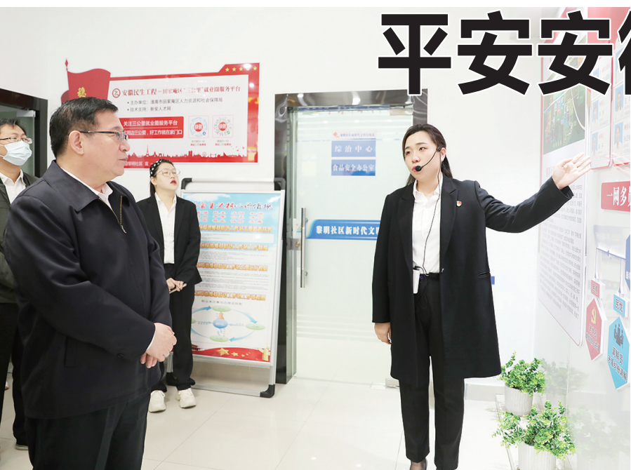
2022年11月1日,省委常委、政法委书记张昀声在淮南市田家庵区洞山街道黎明社区调研网格化管理工作。

常态化开展扫黑除恶、打击电信网络诈骗犯罪、打击整治养老诈骗、开展“江淮风暴”执行攻坚之优化营商环境专项行动、切实解决群众急难愁盼……韶华如飞,大道如砥,2022年,全省政法机关坚持以习近平新时代中国特色社会主义思想为指导,深学笃行习近平法治思想,守正创新,担当作为,交出了平安安徽、法治安徽建设的高分答卷。