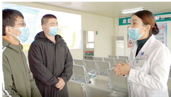
▲警嫂开芳在工作中。

她们的故事,一件件、一桩桩,感人肺腑,催人泪下。监狱戒毒人民警察出征的脚步不能停息,而警嫂们忙碌于白天夜晚,缝补着丈夫的遗憾。无论是月缺月圆,她们总能把风雨,化作霞光满天!千千万万的警嫂们,似梅花傲雪独放、坚韧不拔,似兰花清幽馥郁,默吐芬芳,似葵花心怀感恩、向阳而生,似莲花不染尘埃、清风徐来!