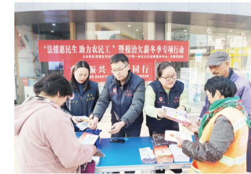
2021年11月16日博望区司法局联合宁博一体化公共法律服务中心及丹阳县司法局在丹阳县镇菜市场附近开展“法律援助民生助力农民工”暨根治欠薪冬季专项行动和“乡村振兴法治同行”主题宣传活动。