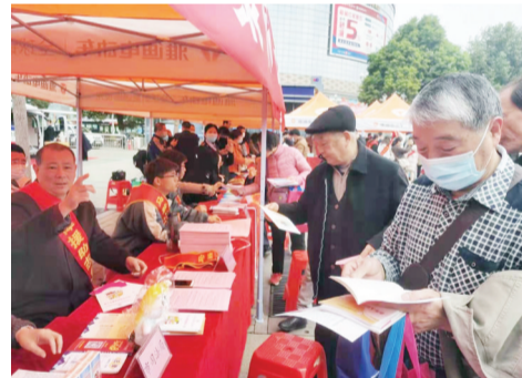
2021年3月15日，马鞍山市法律援助律师与公检法、海关等部门在花山区大华广场为群众开展“3·15”普法宣传服务。