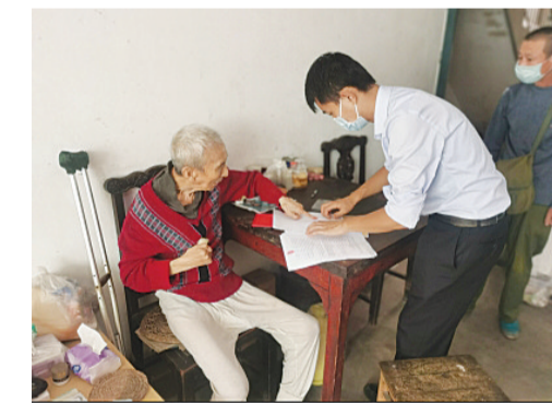
2021年10月14日，在马鞍山市花山区金玉兰小区，公证员免费为90岁老人上门办理继承权公证。

近年来，马鞍山市司法局以实际行动开展服务，传递温暖。先后在全市3家司法鉴定所开展便民、惠民服务，制作便民服务帆布袋、定制“暖心服务”资料袋、健康包，包内装有口罩、宣传单、联系卡等防疫和宣传用品，向办事群众普及司法鉴定程序、方法以及进行司法鉴定的途径等相关知识，目前已发放520余份；推进“互联网+法律服务”，12348平台上预约公证咨询办理共7件，其中国内继承咨询2件、国内委托1件、国内签名2件、涉外亲属关系1件、涉外出生1件；国内签名1件、委托2件、涉外学历证书3件；全市公证、司法鉴定、仲裁机构实现入驻全市公共法律服务中心引导咨询服务“我为群众办实事”。截至2021年7月底，全市七家公共法律服务中心全部实现入驻公证员、鉴定人、仲裁员坐班提供引导咨询服务，从2021年7月16日—12月底已累计为群众提供引导咨询服务847件，其中公证668件、司法鉴定126件、仲裁53件。