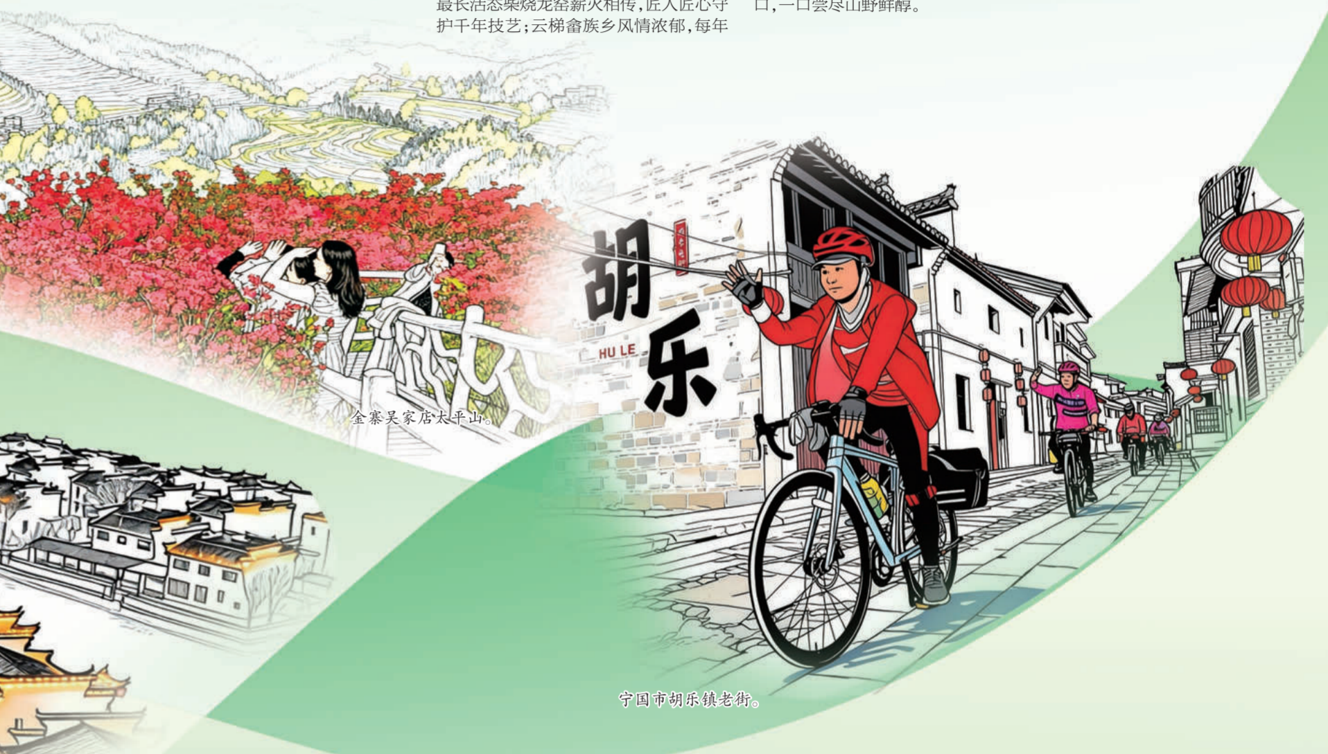
宁国市胡乐镇老街。

“三月三”，畬族阿哥阿妹身着盛装，唱山歌、跳竹竿舞，尽显民俗韵味；河沥老街青石板蜿蜒，非遗手作与特色小吃遍布，藏着市井温情；胡乐老街古朴静谧，明清古建筑保存完好，沉淀着岁月痕迹。 这里是户外休闲的胜地。江南龙门国际滑雪场可体验速度与激情，西村3D墙绘随手出片，恩乐世界木屋村尽享山野风情。宁国粮吧外酥里嫩、山核桃香脆可口，一口尝尽山野鲜醇。