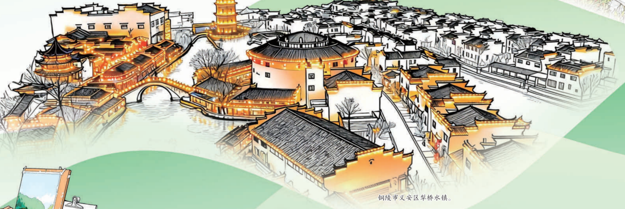
铜陵市义安区翠桥水镇。

当然，泾县的宝藏，远不止眼前的风景。这里，有一首歌。《微笑泾县》唱出泾县人民的温润、和气、友善与包容。无论你来自何方，街头巷尾的一个微笑，就是泾县最真诚的请柬。