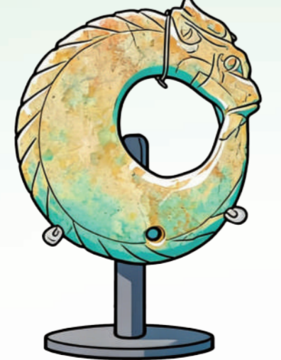
含山县凌家滩遗址出土的玉龙。

一场沉浸式的文明探索。围绕“文物修复”“古法工坊”等精品课程，打造可参与、可体验、可带走的研学旅程。 含山以“探源+”为核心理念，推出“凌家滩研学一日游”“亲子探源套餐”等标准化产品，串联凌家滩、袁神山、六街、太湖山、运漕古镇等全域资源，形成“含山探源N件套”文旅体系。 文明探源，玉见含山。在这里，五千多年曙光触手可及，山水人文四季可游。含山，等你来探寻一段文明，遇一座小城。