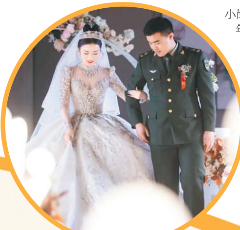
▲ 严妹与爱人携手步入婚姻殿堂。