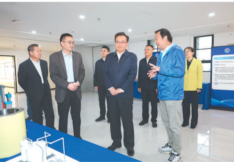
4月21日下午,省委书记梁言顺在合肥综合性国家科学中心能源研究院调研。