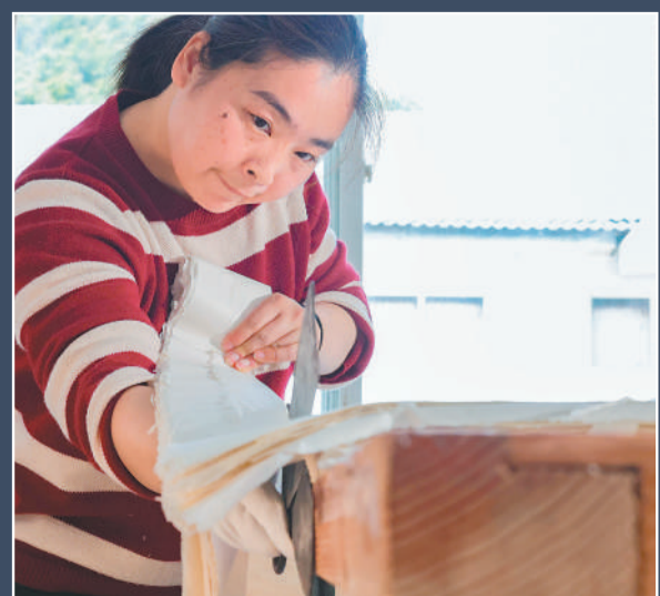
◀ 4月1日，红星宣纸厂剪纸车间，工匠在专注地裁剪宣纸。