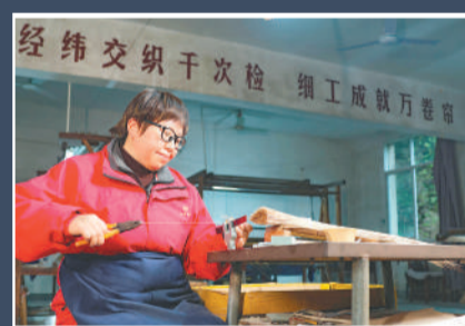
3月31日，红星宣纸厂纸帘生产车间，工匠在抽丝，为纸帘编织准备竹丝。