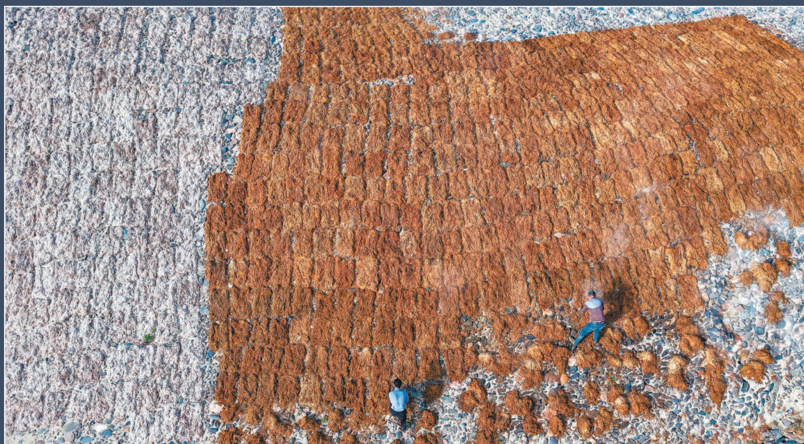
▶ 4月1日清晨，郑村燎草基地的工匠们在山上摊晒燎草。