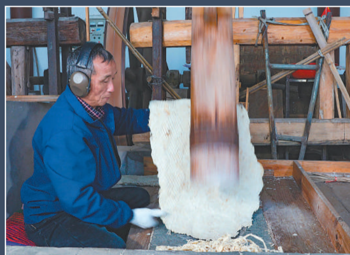
4月1日，在宣纸小镇碓房，工匠在碓皮，通过反复碓打将檀皮纤维打散帚化。