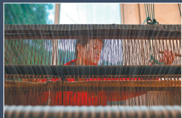
◀ 3月31日，红星宣纸厂纸帘生产车间，工匠在编织纸帘。