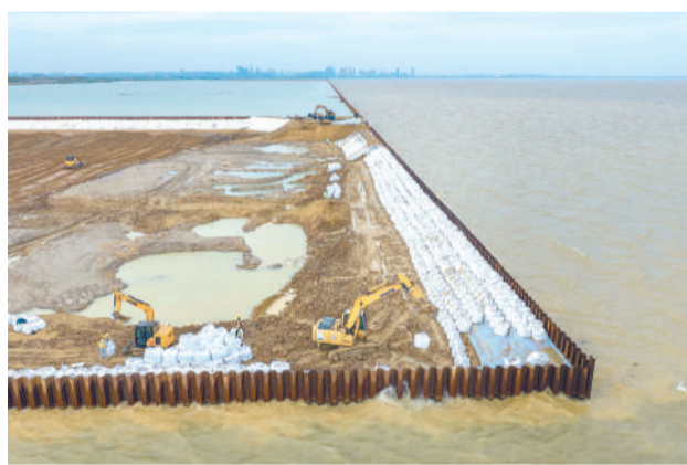
4月7日，环巢湖大道肥西段，巢湖生态清淤及湿地修复一期工程建设加速推进。该工程位于巢湖西半湖及杭埠河口，总投资约3.7亿元。