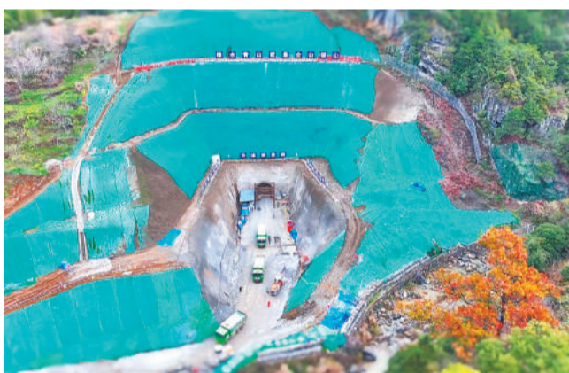
4月7日，绩溪家朋抽水蓄能电站的建设现场一派繁忙景象。该电站总装机容量140万千瓦，总投资83.98亿元，力争2030年全部机组并网发电。