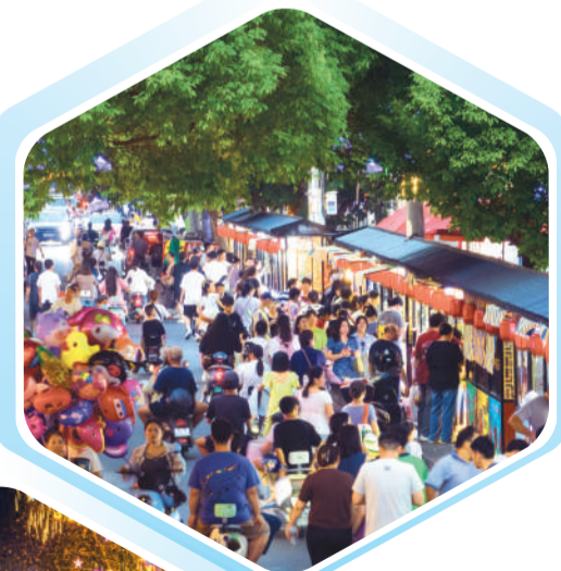
▲ 琅琊区四合路特色美食文化街区。