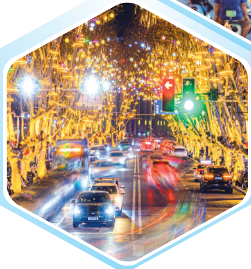
▲ 琅琊区天长路道路亮化提升工程。