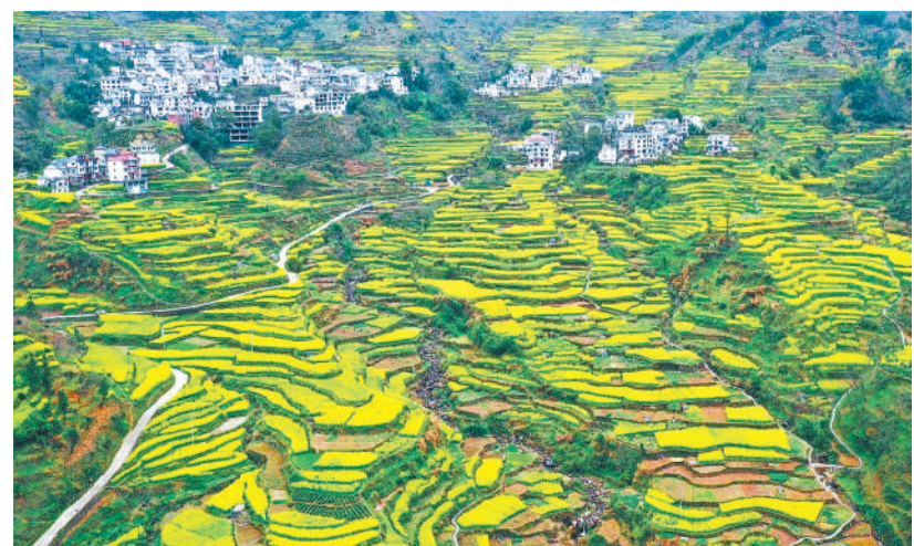
3月19日，春雨初歇，歙县三阳镇白石源村，层层叠叠的梯田油菜花与徽派民居相映成景，美不胜收。