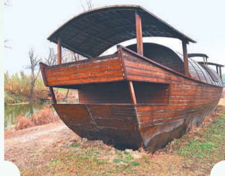
大运河泗县段附近打造的古船景观。

“活水”滋养“活力”。“汴水流，泗水流，流到瓜洲古渡头。”泗县人喜欢吟诵白居易那首《长相思·汴水流》，也喜欢吟唱泗州戏。2025年秋，泗县百姓茶馆在大运河畔开张。这座建筑与运河景观浑然一体，散发出传统文化气息。“喝大壶茶、听泗州戏、品千年运河文化，泗县从此多了一处文化新地标。”茶馆负责人介绍。作为“政府引导+市场运作”的创新实践，茶馆将茶文化与泗州