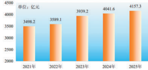
2021—2025年全省一般公共预算收入

全年社会融资规模增量11656.8亿元;年末社会融资规模存量131276.4亿元,比上年末增长9.3%。年末金融机构本外币存款余额99499.5亿元,比年初增加7778.1亿元,增长8.5%,其中人民币存款余额98269.6亿元,比年初增加7477.3亿元,增长8.2%;金融机构本外币贷款余额93606.4亿元,比年初增加7345.5亿元,增长8.5%,其中人民币贷款余额93317.5亿元,比年初增加7309.0亿元,增长8.5%。