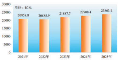
2021—2025年全省社会消费品零售总额

全年限额以上单位商品零售额中,粮油类零售额比上年增长6.8%,肉禽蛋类增长6.8%,服装类增长3.9%,日用品类增长10.9%,家用电器和音像器材类增长6.9%,中西药品类增长1.4%,家具类增长3.7%,通讯器材类增长32.5%,建筑及装潢材料类增长3.6%,汽车类下降2.9%,石油及制品类下降3.5%。