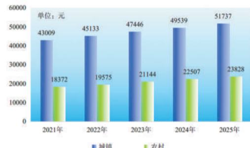
2021—2025年全省城镇、农村居民人均可支配收入

年末参加城镇职工基本养老保险人数为1781.7万人;参加城乡居民基本养老保险人数为3367.9万人;参加基本医疗保险人数为6209.6万人;参加失业保险人数为739.7万人,全年为27.1万名失业人员发放了不同期限的失业保险金;参加工伤保险人数为988.1万人;参加生育保险人数为856.2万人。年末21.2万人享受城市居民最低生活保障,158万人享受农村居民最低生活保障,30.5万人享受农村特困人员救助供养。