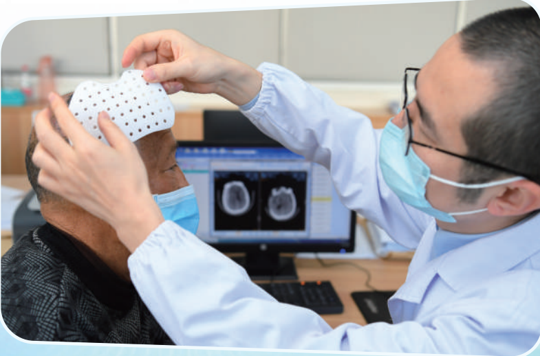
安医大一附院神经外科创新使用3D打印“保护帽”帮助修复缺损颅骨。