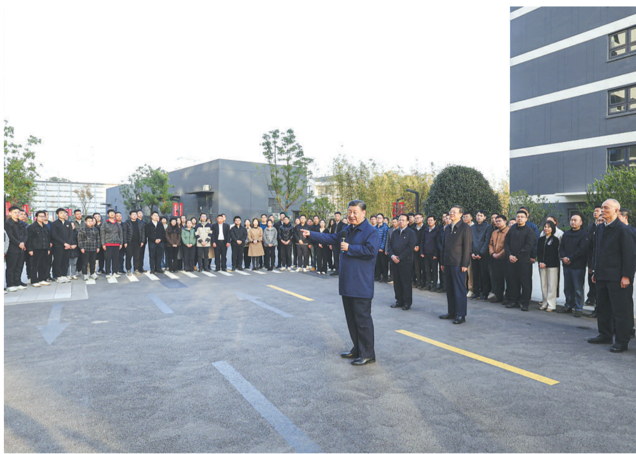
11月28日至12月2日,中共中央总书记、国家主席、中央军委主席习近平在上海考察。这是11月29日下午,习近平在闵行区新时代城市建设者管理者之家,同社区居民亲切交流。

新华社上海/江苏盐城12月3日电 中共中央总书记、国家主席、中央军委主席习近平近日在上海考察时强调,上海要完整、准确、全面贯彻新发展理念,围绕推动高质量发展、构建新发展格局,聚焦建设国际经济中心、金融中心、贸易中心、航运中心、科技创新中心的重要使命,以科技创新为引领,以改革开放为动力,以国家重大战略为牵引,以城市治理现代化为保障,勇于开拓,积极作为,加快建成具有世界影响力的社会主义现代化国际大都市,在推进中国式现代化中充分发挥龙头带动和示范引领作用。 11月28日至12月2日,习近平在中