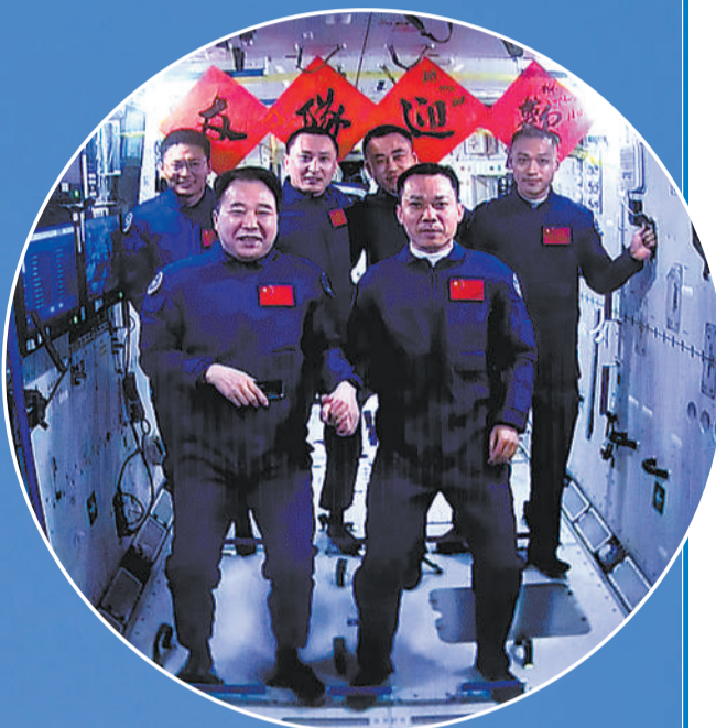
10月26日拍摄的神舟十七号航天员乘组和神舟十六号航天员乘组“全家福”。