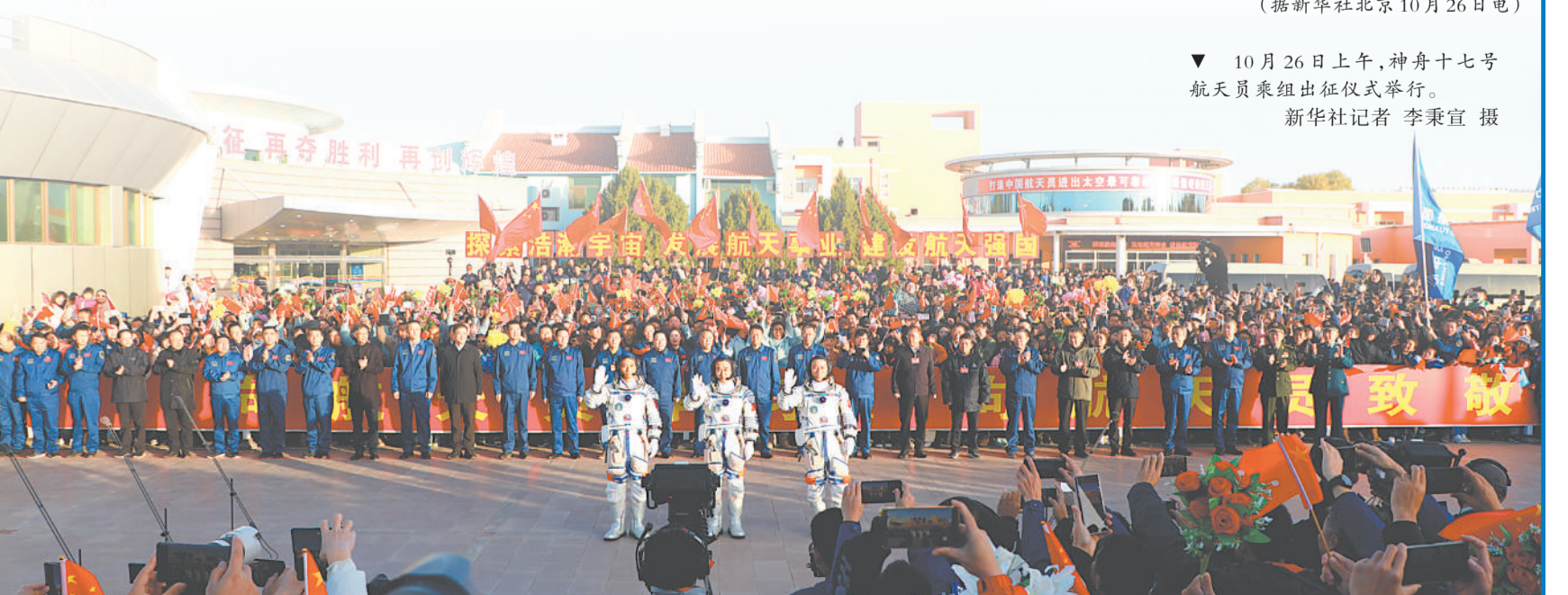
10月26日上午,神舟十七号航天员乘组出征仪式举行。