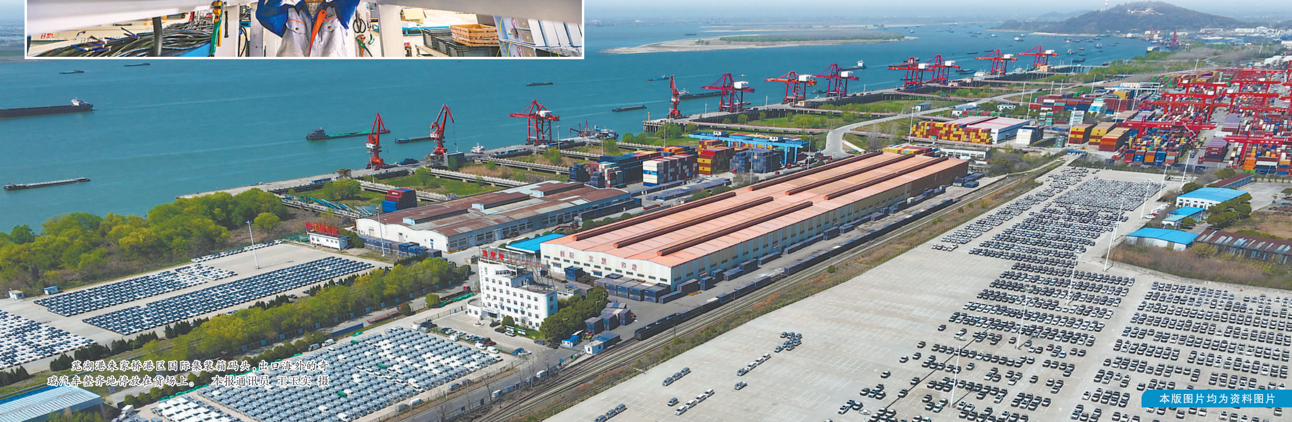
芜湖港朱家桥港区国际集装箱码头,出口海外的奇瑞汽车整齐地停放在货场上。