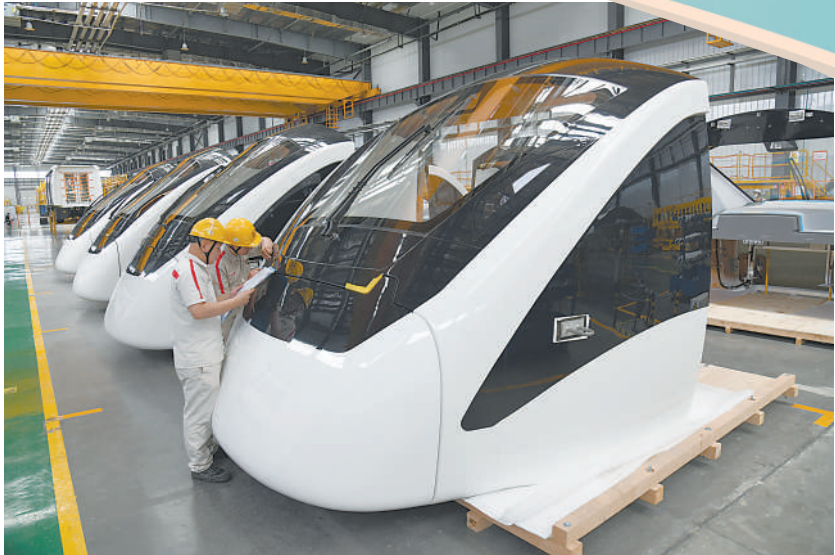
在芜湖经开区中车浦镇阿尔斯通运输系统有限公司,工人在生产出口埃及开罗的单轨车辆。