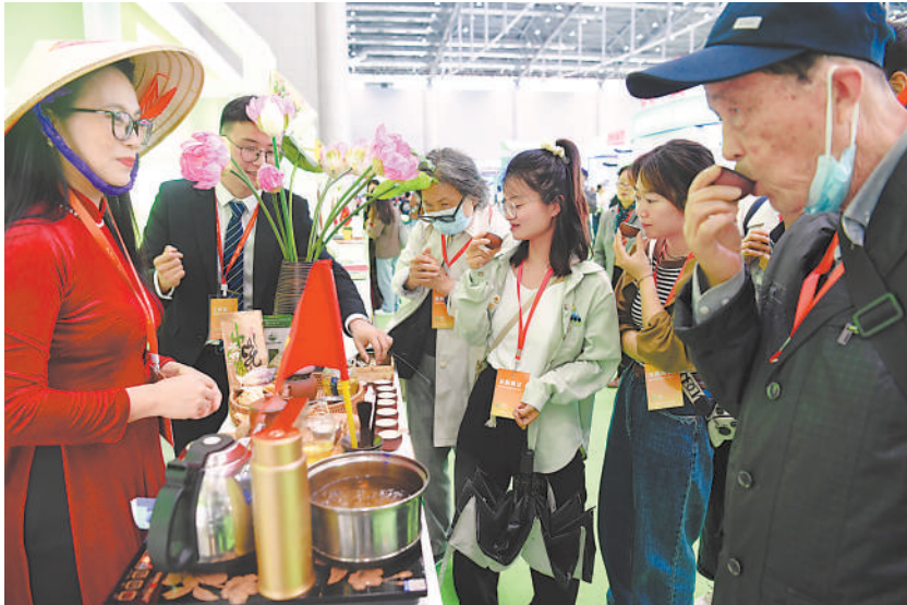
2023第十六届安徽国际茶产业博览会首次设立国际名茶展区,邀请了斯里兰卡、泰国、越南等国家参展。图为采购商在国际展区品茶。