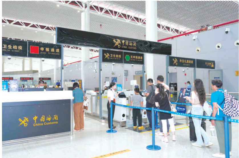
8月14日,中国东航在合肥开通合肥—新加坡航线。航线的开通,为两地互联互通、交流合作搭建起了空中桥梁。