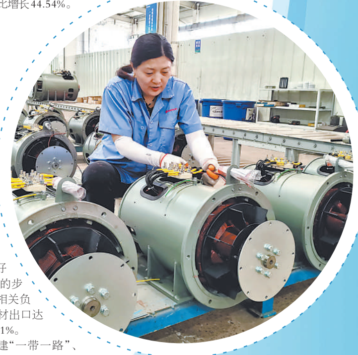
位于合肥市庐江高新区的德科电气科技有限公司生产车间内,工人正在赶制出口非洲的订单产品。