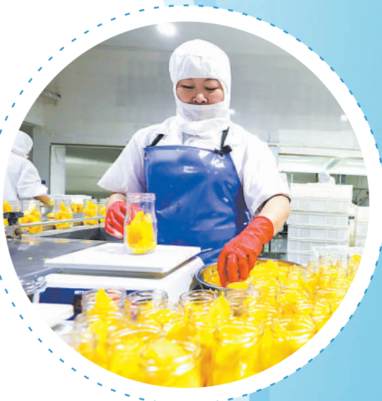
淮北市凤凰山食品工业园贝宝食品有限公司工人正在生产出口的黄桃罐头。