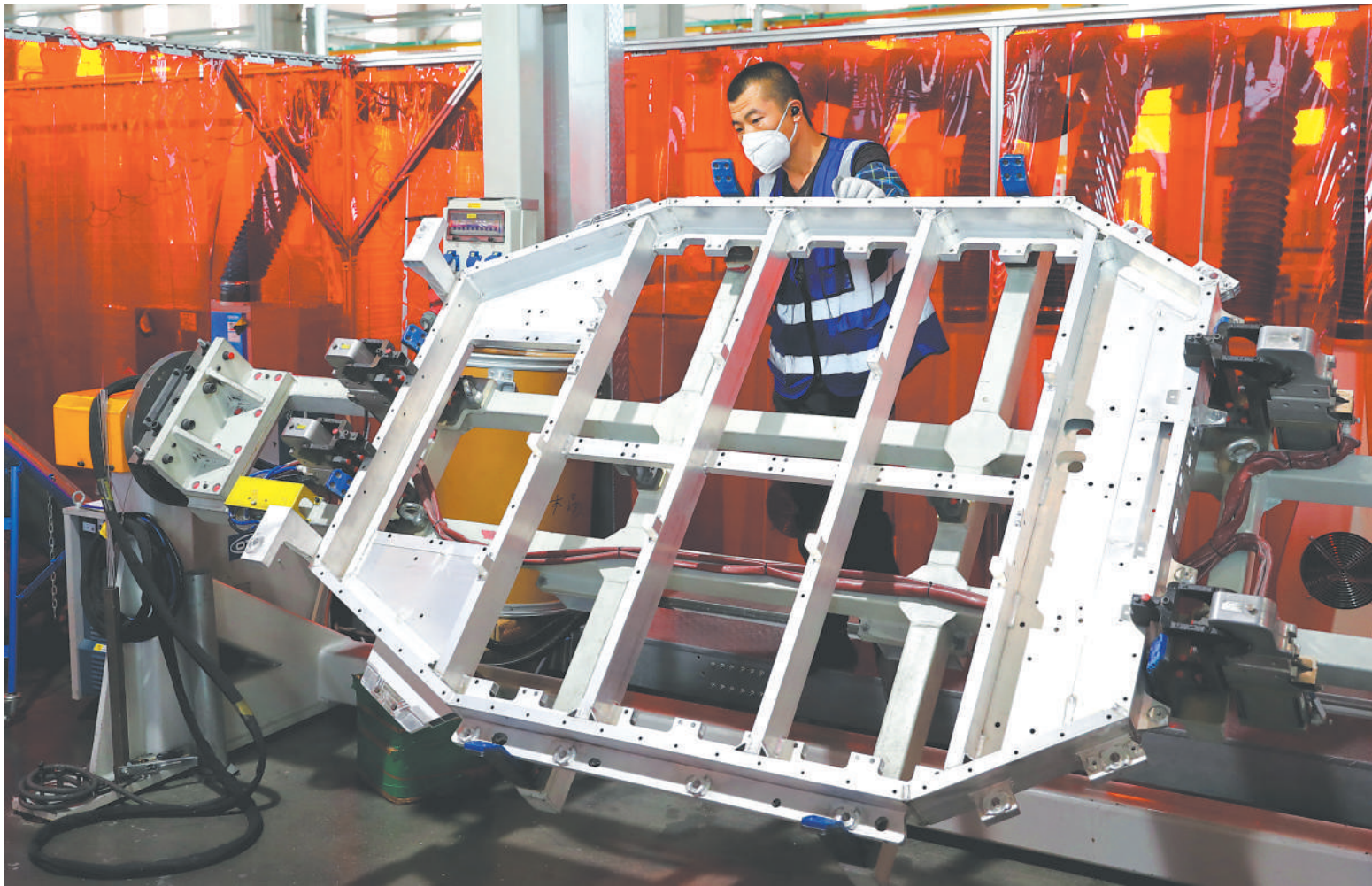
▲ 近日,在位于合肥新站高新区的合肥维信诺科技有限公司展厅内,工作人员在演示该公司新能源车载显示科技领域的创新。