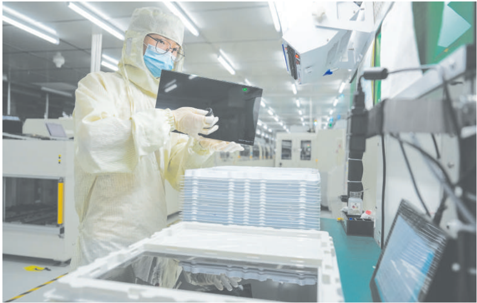
▲ 近日,在位于蚌埠高新区的蚌埠国显科技有限公司生产车间内,技术人员在对试产中的车载触控显示模组生产线设备进行调试。