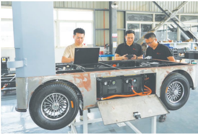
▲ 近日,在位于合肥包河经开区的合肥思卡途汽车科技有限公司车间内,技术人员在调试适用于新能源智能驾驶场景的专业线控底盘。