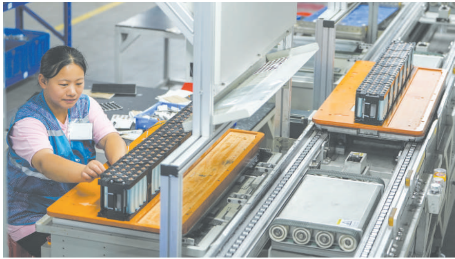
▲ 近日,在位于安庆经开区的江淮华霆(安庆)电池系统有限公司车间内,工人在生产新能源汽车动力电池。