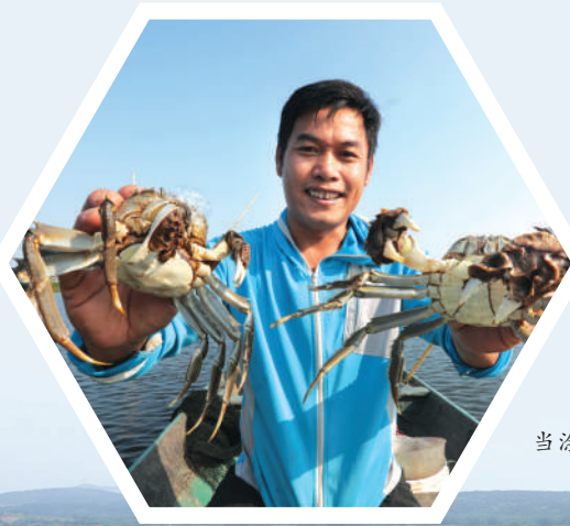
“蟹中之王”当涂河蟹。