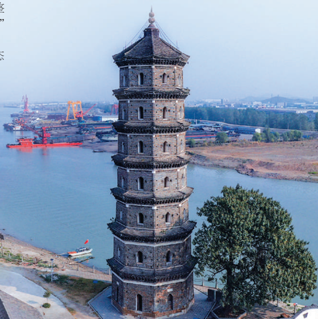
姑孰镇八景台公园。