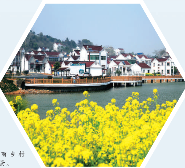
美丽乡村唐村新景。