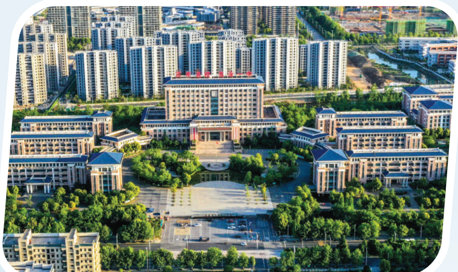
百年名校当涂一中。