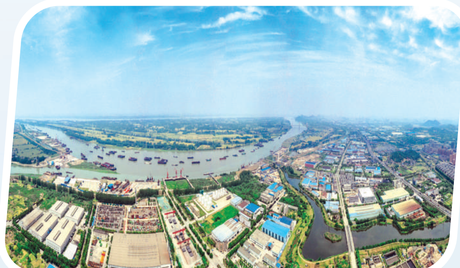
航拍当涂经济开发区。