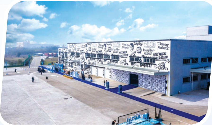
全球燕麦植物基品牌中国首座工厂在当涂投产。

现在的“教育厅”),1906年裁撤,历时181年。 如今,当涂“承东接西、连南带北”的地理优势更加凸显。水路有长江黄金岸线约20公里,港口码头7个。高铁有宁安高铁,到南京28分钟,到上海2个半小时。目前正在建设宁马城际铁路、巢马高铁,2025年建成运营后,坐地铁到南京中心城区只要20分钟,乘高铁去合肥40分钟、去上海1个半小时。 公路有宁芜高速、沪武高速、205国道等,规划的合杭高速、宁宣黄高速在大公圩均有出入口,届时实现县城范围内15分钟上高速。 机场有南京禄口机场、芜宣机场,均在“1小时交通圈”。 从中原进入江东的跳板,到安徽融入长三角一体化发展的“桥头堡”、地理意义上的首“当”其冲,造就了当涂发展的无限潜力。