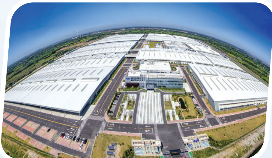
奥克斯当涂生产基地。