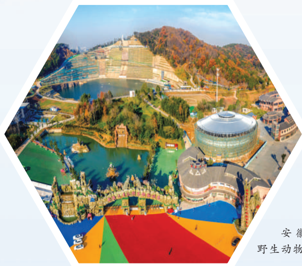
安徽大青山野生动物世界。