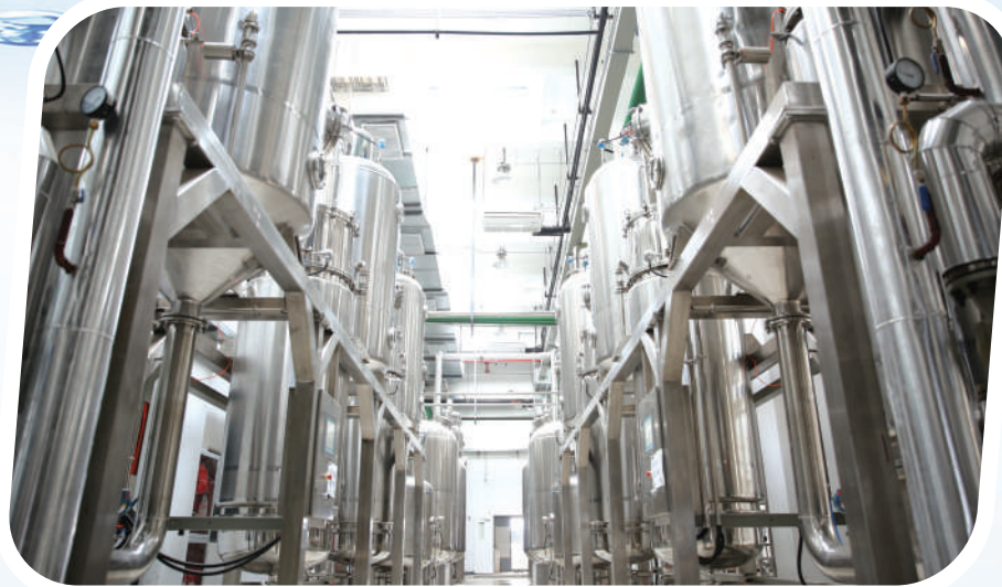
世界五百强利洁时桂龙药业。