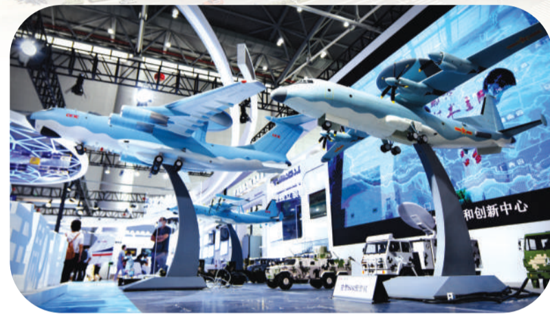
在世界制造业大会现场亮相的中国电科38所展出的预警机模型。

上半年,合肥高新区积极做强制造业集群,加快培育新兴产业,提前布局未来产业,规上工业增加值238.4亿元,位居开发区第一,同比增长10.5%,已成为稳增长的关键力量。六大主导产业中,4个产业实现正增长,光伏新能源产业尤为迅猛,产值同比增长67.1%。