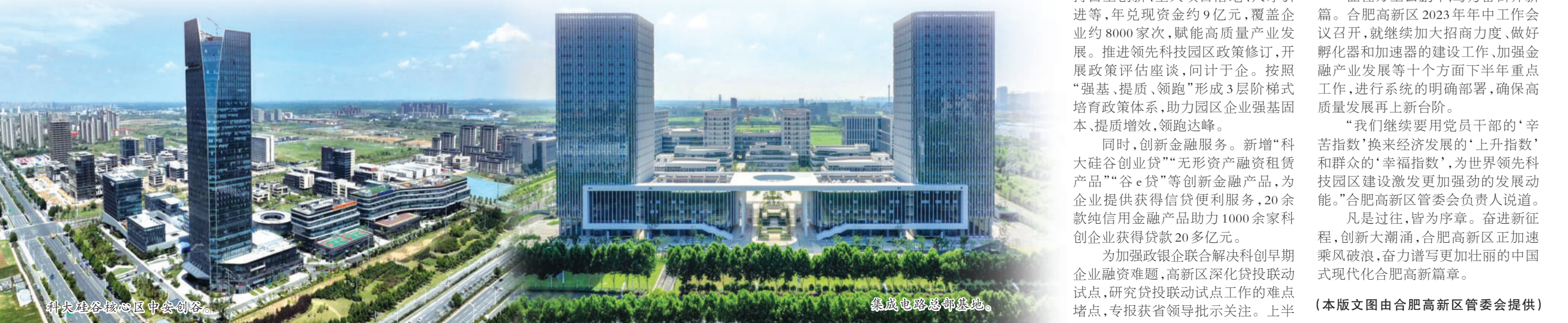
科大硅谷核心区中安创客。

“让人才愉快生活,愉快创新。”合肥高新区管委会相关负责人介绍,接下来,高新区将高标准规划建设蜀西湖商圈,增强商圈活力,启动南岗老街旧城改造工程,在保护历史文化和人文环境的同时,融入现代城市元素,打造一个既具有历史底蕴又有现代气息的商业文化中心。