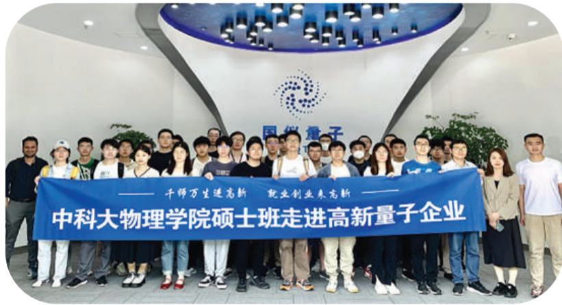
中科大物理学院硕士班走进高新量子企业。