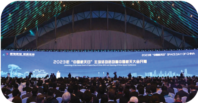
2023年“中国航天日”主场活动启动仪式。