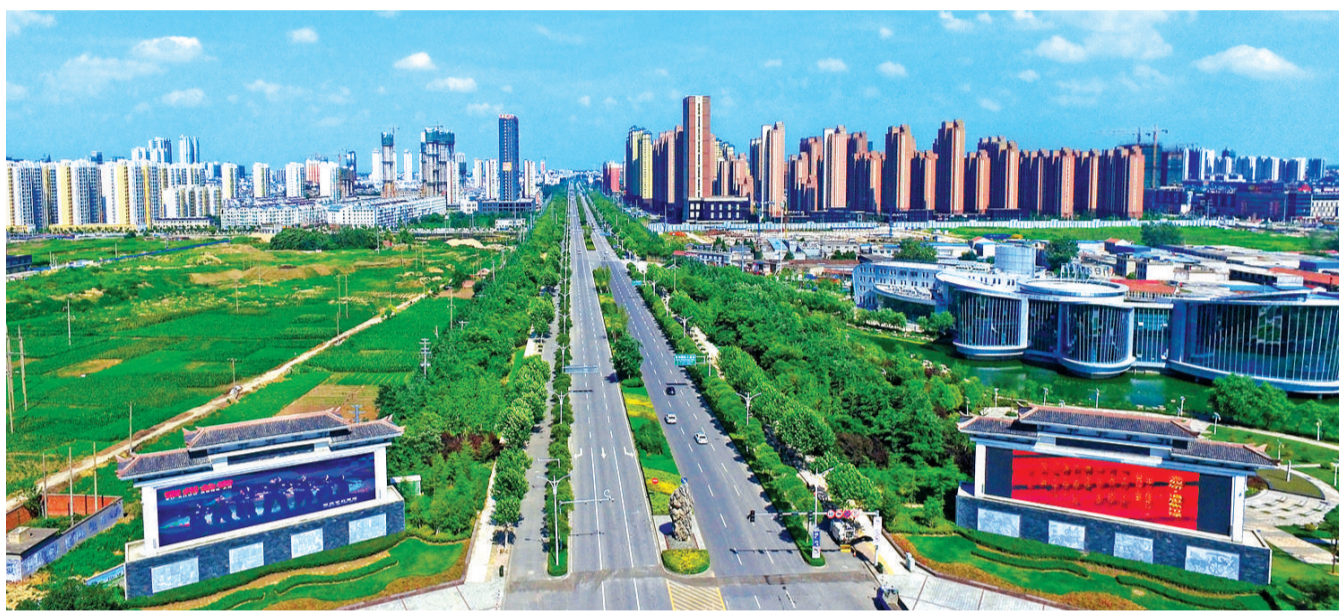
迎宾大道。(资料图片)

以“三园”(道东街道国防园、三八街道国防园、三八街道国防园、三八街道国防园)、“两街”(西关街道振兴社区双拥文化街、三里湾街道双拥街)、“一路”(道东街道翠园社区双拥路)为主