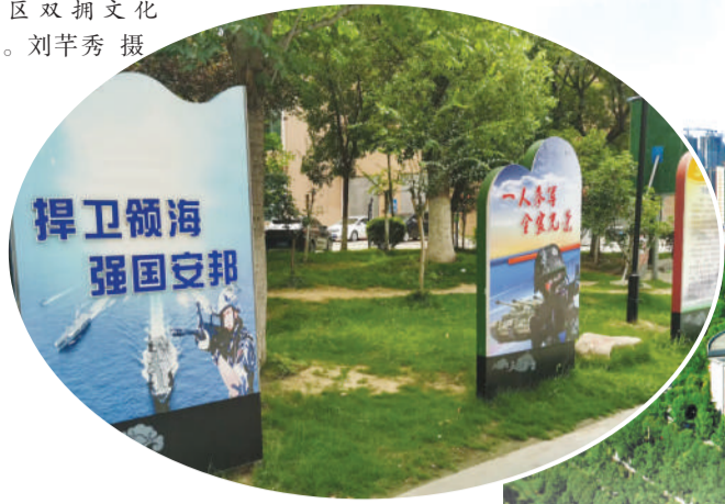
宿州市埇桥区三八街道国防园。