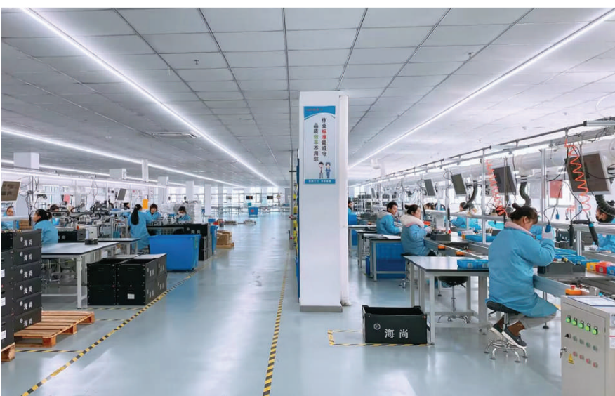
安徽海尚变频技术有限公司生产车间。徐学春 摄

抓改革，塑造县域发展强引擎。实施开发区管理体制综合改革，张江蕲县高科技园经验做法入选全国、全省改革典型案例。深化“亩均论英雄”改革，在全市首推“亩均英雄贷”，2022年规上工业亩均税收增长22.8%，成为皖北唯一入选全省“亩均论英雄”改革工作有力、成效明显的县区，并成功举办全省“亩均论英雄”改革工作现场会。(朱新华)