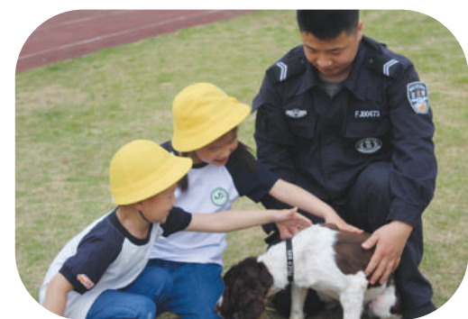
合肥市宿州路幼儿园中班年级组的孩子们与警犬“亲密接触”。(资料图片)

犬犬舍,了解警犬品种及作战本领。训练有素的警犬们在训导员的指挥下完成站、坐、卧、立等整套动作,警犬们在搜寻物证和救人过程中展现出高超本领,赢得孩子们阵阵欢呼,纷纷为警犬的智慧和忠诚点赞。