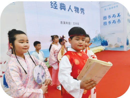
合肥市长江路第三小学兰亭分校举办“沐浴书香 幸福成长”诗书节活动。(资料图片)

近日,合肥市长江路第三小学兰亭分校举办“沐浴书香 幸福成长”诗书节活动。全国阅读专家孙照保、全校师生家长近2000人参加此次活动,共享快乐诗书时光。为进一步推动“四个兰亭”建设,营造家校浓厚的读书氛围,兰亭分校以“办一场真正属于孩子们的诗书节”为宗旨,打造集“展示、互动、体验、竞猜”为一体的诗书节活动。本次活动是兰亭分校的第二届诗书节,具有全员参与、互动性强等特点。