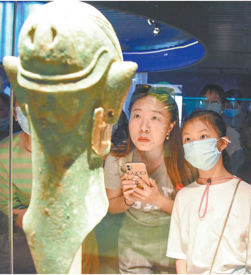
◀ 三星堆出土的戴金面罩青铜人头像。