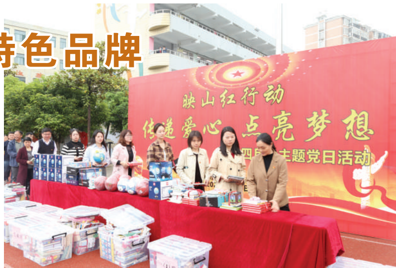
合肥市方桥小学党组织开展主题党日活动。(资料图片)

师德师风工作,支部加强廉政教育,定期召开组织生活会,通过党员民主评议开展批评和自我批评,让全体党员筑牢思想防线。此外,学校举办师德演讲比赛、师德征文、党员送教上门、党员义务劳动等活动,营造“学先进、当先进”的浓厚氛围。为进一步提升党性修养,学校设立“党员活动日”,支部开展“党员大走访”、庆国庆、颂党恩等活动,充分发挥“党徽领航”品牌作用。据不完全统计,2022年度党员教师共开展课后服务近3000人次,服务学生8万人次以上。目前,学校正参加“星级党支部”评选活动,向“五星级党支部”迈进。