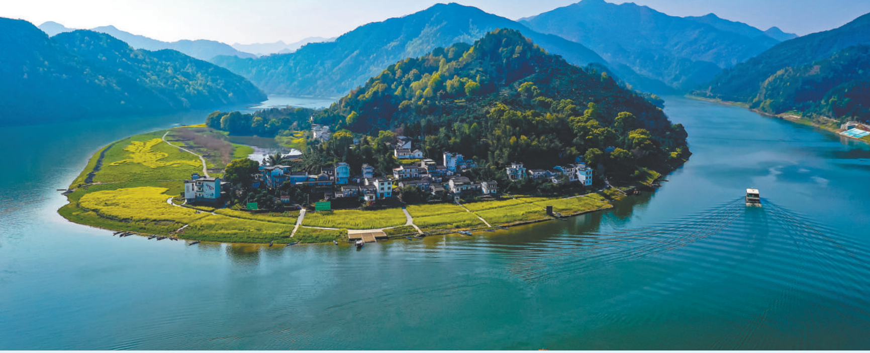
4月2日，观光游船航行在新安江黄山市歙县段江面，青山绿水与徽州古村落相映成趣的山水画廊风光吸引八方游客陶醉其间。