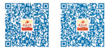
扫码阅读报告全文

《关于2022年国民经济和社会发展计划执行情况与2023年国民经济和社会发展计划草案的报告》共分三部分：2022年国民经济和社会发展计划执行情况；2023年经济社会发展总体要