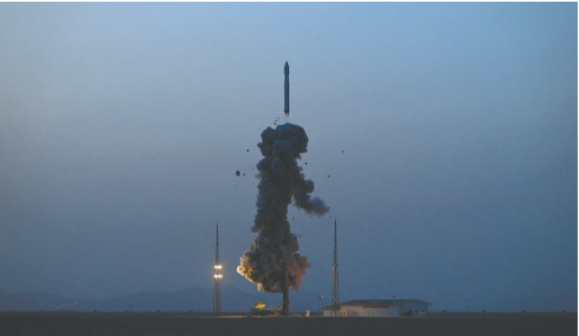
3月15日19时41分，我国在酒泉卫星发射中心使用长征十一号运载火箭，成功将试验十九号卫星发射升空，卫星顺利进入预定轨道，发射任务获得圆满成功。这是长征十一号运载火箭2023年首次发射，也是自首飞以来第16次发射，实现16连胜。