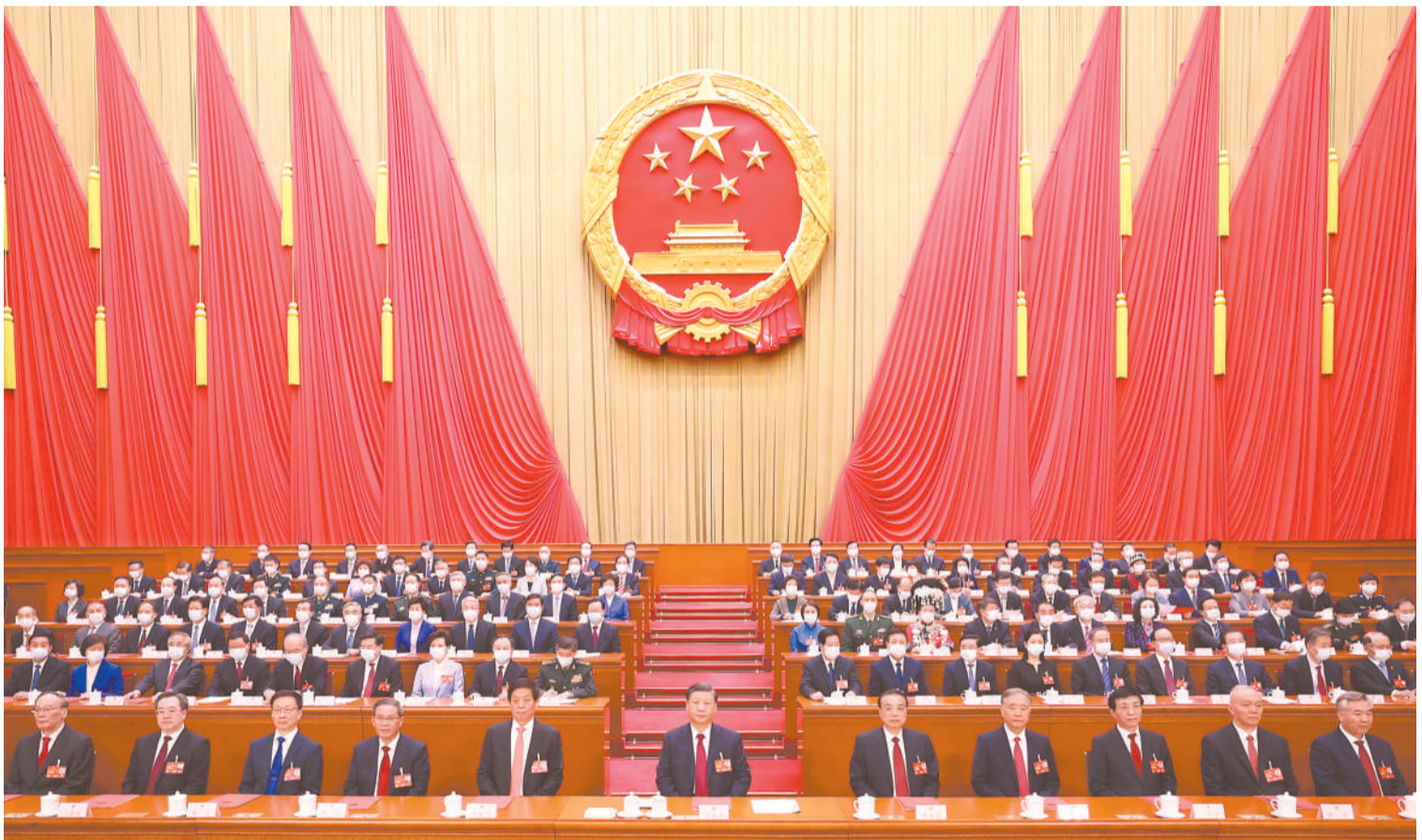
3月13日,第十四届全国人民代表大会第一次会议在北京人民大会堂闭幕。习近平等党和国家领导人在主席台就座。

大会号召,全国各族人民更加紧密地团结在以习近平同志为核心的党中央周围,高举中国特色社会主义伟大旗帜,坚持以习近平新时代中国特色社会主义思想为指导,全面贯彻党的二十大精神,自信自强、守正创新,凝心聚力、埋头苦干,为全面建设社会主义现代化国家、全面推进中华民族伟大复兴而团结奋斗!