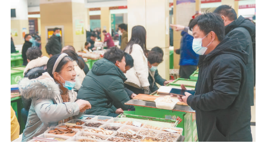
2月13日,在亳州中药材专业市场,来自全国各地的药商在采购药材。

中药材是亳州的“金字招牌”。从最初肩扛手提、走街串巷贩卖中药,再到如今涵盖中药材种植、加工制造、流通、科研和中药文化传播等全产业链体系,经过多年努力,这座弥漫着药香的城市已成为全球最大的中药材集散中心和价格形成中心。