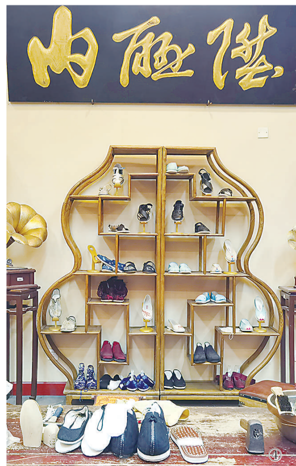
图④ 1月31日在北京前门内联升总店内拍摄的手工布鞋。新华社记者 谢希瑶 摄