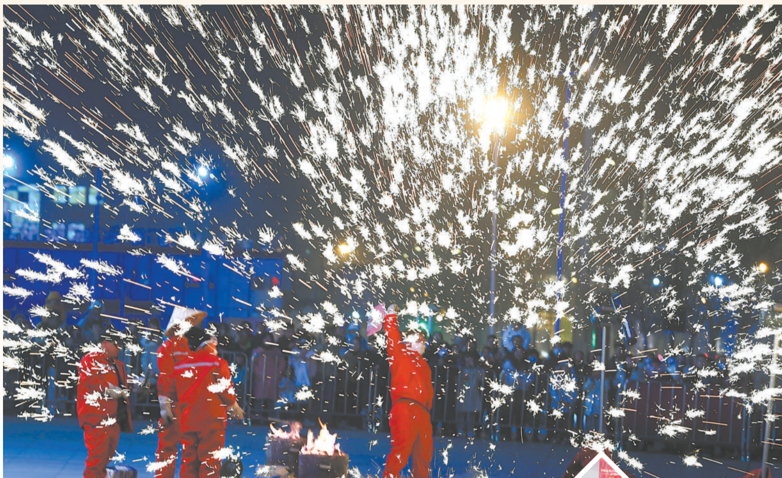
▲ 1月22日，在亳州市谯城区万达广场，民间艺人正在表演非遗“打铁花”。

金虎辞旧岁，瑞兔迎新春。连日来，江淮大地处处欢天喜地，年味浓浓！各地纷纷举办丰富多彩的非遗、民俗等展演活动，精彩纷呈的节目，让人民群众在浓郁的喜庆氛围中感受中华传统文化的独特魅力。