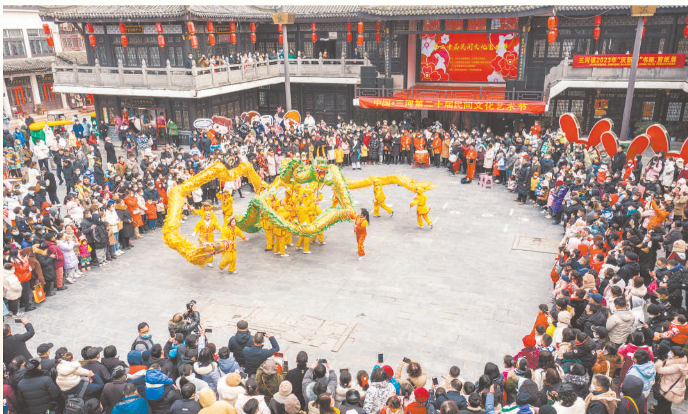
▲ 1月24日，合肥市肥西县三河镇举办“民间文化艺术节”活动，当地民间艺人通过舞龙、闹花船、河蚌舞等民俗展演巡演，让游客体验古镇独特魅力，感受春节的热闹氛围。