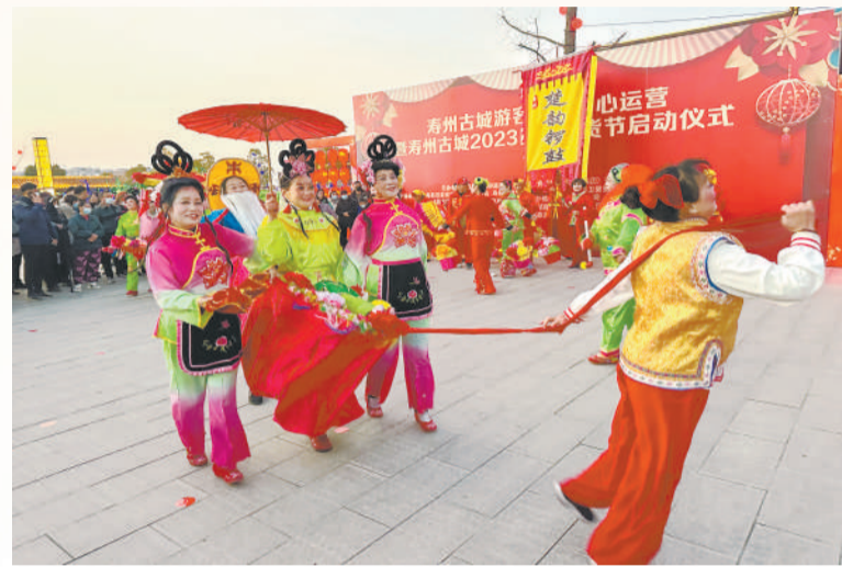
▲ 春节前夕，寿县举办2023民俗文化节，楚韵锣鼓、花鼓灯等非遗项目纷纷亮相。