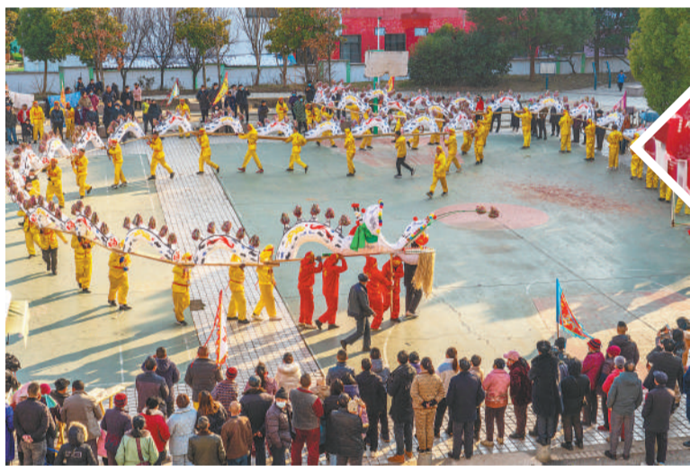
▲ 春节前夕，芜湖市湾沚区东头村村民在舞龙灯辞旧迎新。