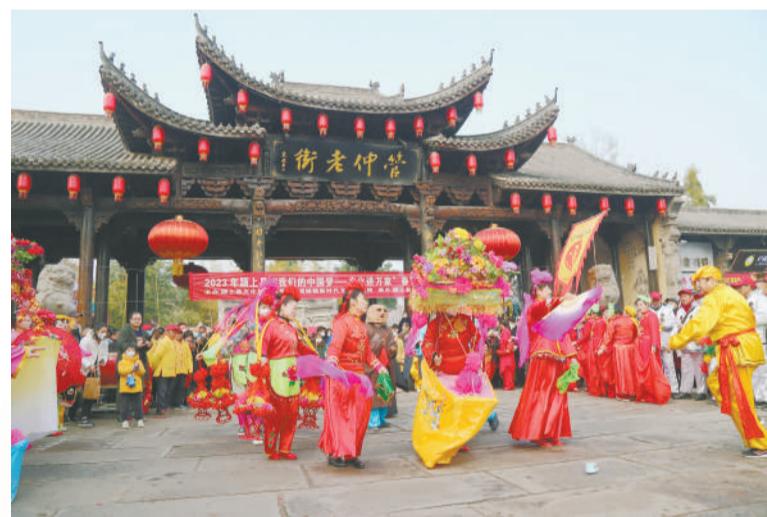
▲ 1月22日，颍上县“我们的中国梦——文化进万家”春节非遗项目踩街活动在管仲老街举行，群众赏非遗、观民俗，欢喜贺新春。

▶ 新春佳节之际，宁国市云梯畲族乡千秋村村民制作特色传统美食，让游客领略浓郁的畲乡年味风情。目前，该乡有“畲乡人家”品牌农家乐60余家，去年接待游客30余万人次。