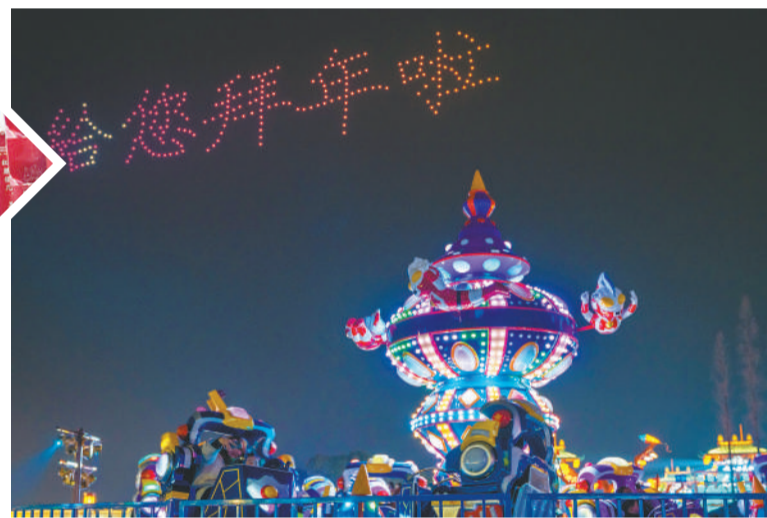
▲ 1月22日，马鞍山市长江不夜城景区上演无人机灯光秀。