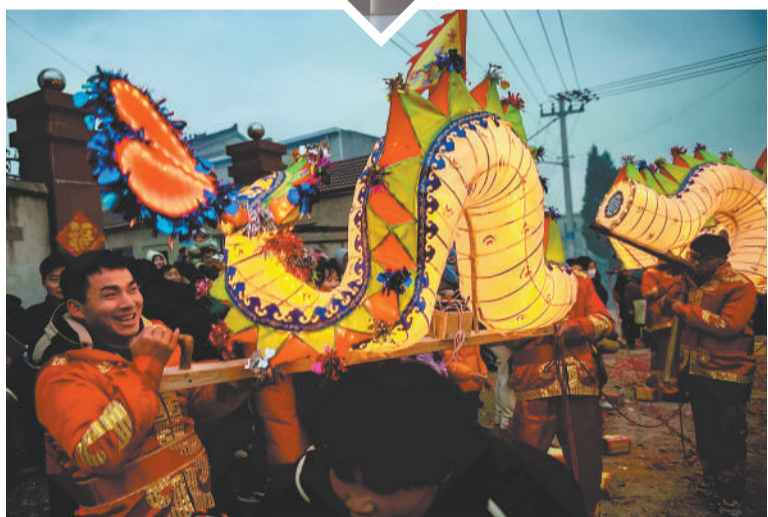
▲ 1月22日，含山县清溪镇大贾村村民们自发组织龙灯表演，喜迎新春佳节。