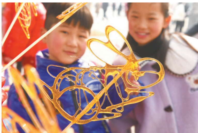
▲ 1月22日，在阜阳市颍泉区非遗展演展示活动现场，非遗糖画“兔子”造型吸引了小朋友目光。