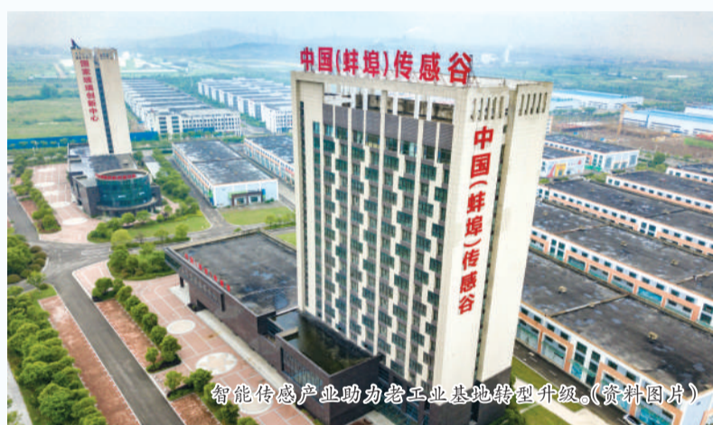
智能传感产业助力老工业基地转型升级。(资料图片)

一系列支撑性的指标，凸显出蚌埠经济运行态势的不断向好——去年1-11月份，蚌埠规上工业利润总额增长43.2%，连续6个月居全省第1位；营业收入增长13.4%，居全省第4位。工业用电量增长13.3%，居全省第3位；工业用气量增长30.6%，居全省第1位；工业用地152宗，面积10348亩，增长46%。报批各类用地4.9万亩，增长246%，约占全省1/10。蚌埠2022年全年税收收入256.58亿元，总量居全省第4位，增幅居全省第4位。剔除留抵退税因素影响，2022年全年税收收入293.04亿元，增幅6%，总量居全省第5位，增幅居全省第8位。