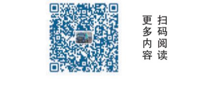
更多内容 扫码阅读

为加强风纪养成，规范队伍管理。全省公安交管部门组织开展队伍风险隐患研判排查、违法违纪风险预测预警评估，采取针对性防范措施；强化民警日常监督管理，并延伸到“八小时以外”，及时发现解决苗头问题；健全完善执法管理体系机制，实现对源头管理、路面执法、交通事故处理等环节的全方位、全流程、全要素监管，推进执法公开，主动接受群众监督，确保执法既有力度、又有温度。