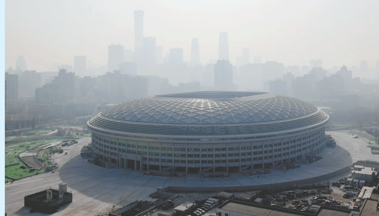
这是1月6日拍摄的北京工人体育场外景。

当日,记者从北京市重大项目办获悉,历时两年多,北京工人体育场改造重建项目足球场主体工程建设任务完成,“新工体”成为全国首批、北京首座国际标准专业足球场。目前,“新工体”已具备办赛条件,待周边环境整治和商业设施建设收尾后,将迎接北京国安足球队回归主场。