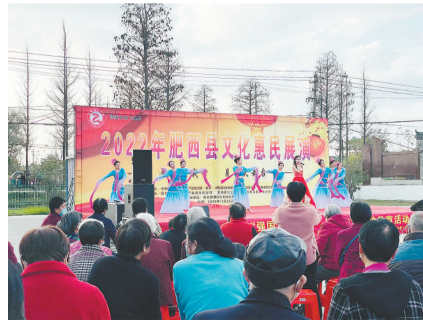
日前,肥西县“文明伴我行·月末大舞台”文化惠民活动在各乡镇巡回演出,展现乡村振兴新貌和民生成就。

房屋安全整治“回头看”,严格执行房屋质量安全强制性标准,加大对违法建设、违规审批房屋的清查力度,全力消除存量、遏制增量。 三、科学精准施策。严格落实属地管理责任、行业部门监管责任、所有权人主体责任、使用人使用安全责任。指导各地因地制宜,因房施策加快经营性自建房屋整改进度,结合棚户区改造、城中村改造等工程,探索多渠道化解政策障碍,集中化解一批自建房屋安全隐患。组织设计、施工、监理、检测、鉴定等机构、行业企业技术人员和乡村建设工匠等参与专项整治,强化技术保障。综合运用互联网、云计算、大数据等手段,加强房屋安全动态监测。 四、健全长效机制。加快推进立法进度,省政府出台《安徽省自建房屋安全管理办法》,争取尽快出台《安徽省自建房屋安全管理条例》。建立“安徽省房屋安全综合管理信息系统”,推进房屋安全管理工作科学化、信息化、常态化。按照国家统一部署安排,探索房屋体检制度、房屋养老金制度、房屋质量保险制度。强化群防群治,加大宣传引导,增强居民房屋安全意识、公共安全意识、法治意识,促进自建房屋所有者提高自我保护、自我防范的安全意识。