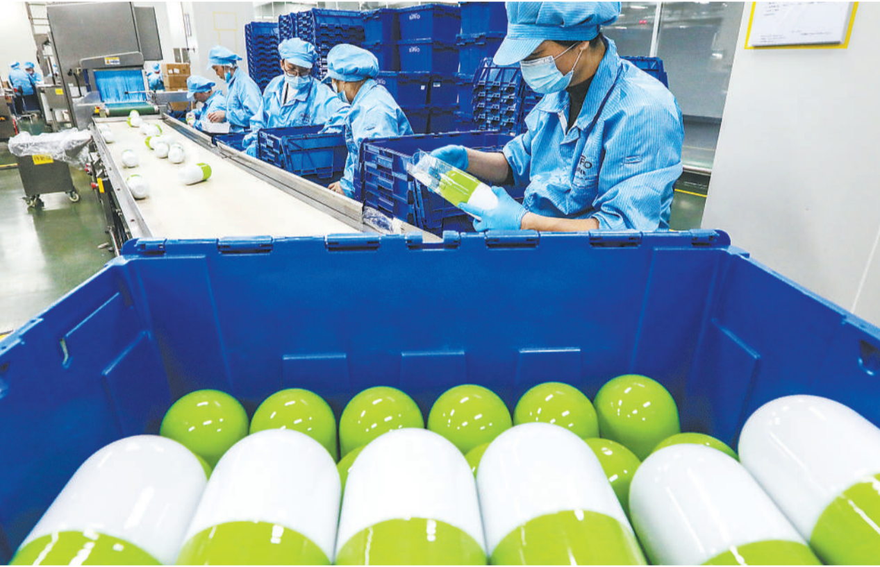
12月7日,位于马鞍山经开区的仙乐健康科技(安徽)有限公司员工在包装出口的软糖产品。近年来,马鞍山经开区大力开展食品产业技术改造,不断延伸产业链条,聚力打造绿色食品领军产业集群。