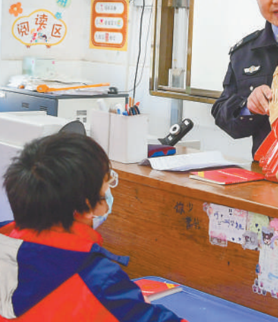
日前,肥西县紫蓬镇司法所普法工作者走进辖区县烧脉中学开展“宪法知识进校园”主题宣传活动,通过为学生发放宪法读本、讲解宪法知识等方式,增强学生法治观念,弘扬宪法精神。