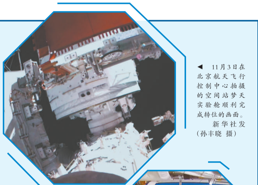
11月3日在北京航天飞行控制中心拍摄的空间站梦天实验舱顺利完成转位的画面。