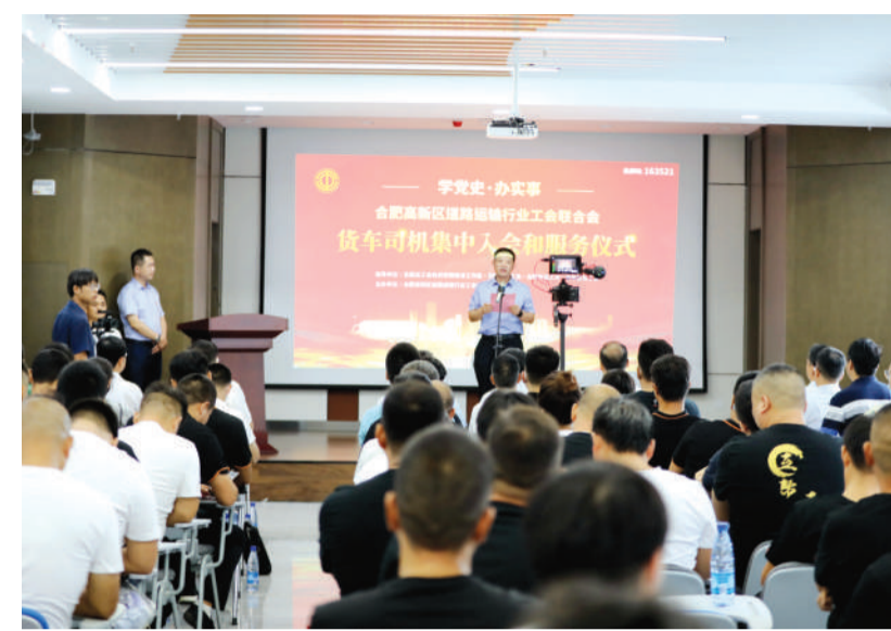
2021年7月23日,合肥高新区道路运输行业工会联合会举办以“学党史、办实事”为主题的货车司机集中入会和服务仪式。(资料图片)

今年,安徽省总工会制定出台《安徽省民营企业工会工作规范(试行)》文件,重点围绕基层工会“六有”建设标准,从组织建设、队伍建设、工作任