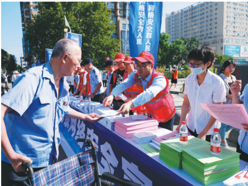
9月3日,五河县志愿者在青年圩广场向市民发放网络安全宣传材料。