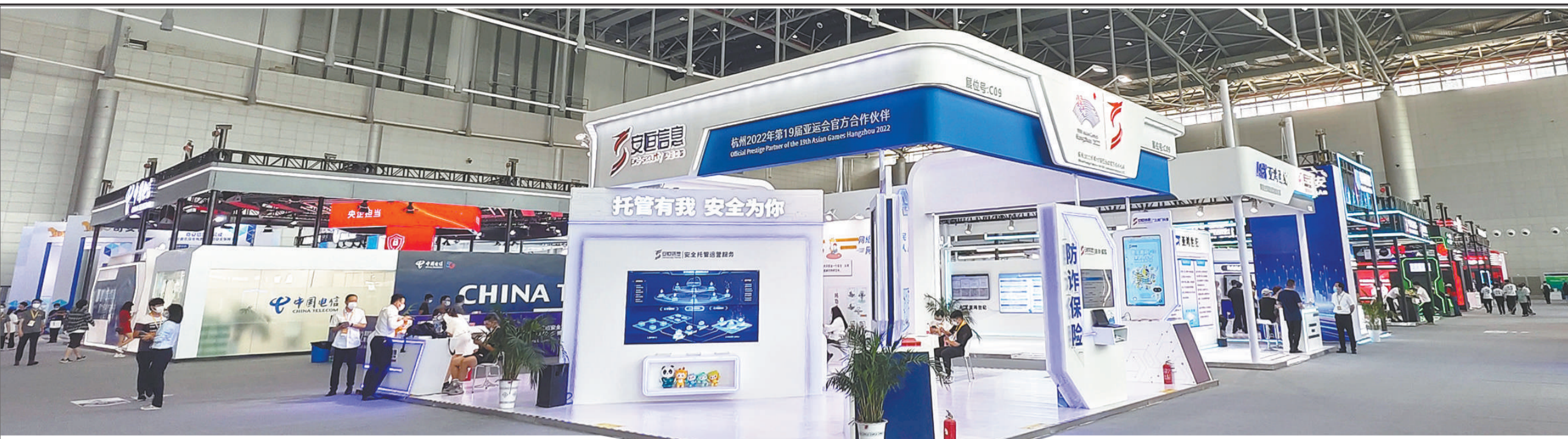
9月5日,2022年国家网络安全宣传周在合肥开幕。图为网络安全博览会现场。