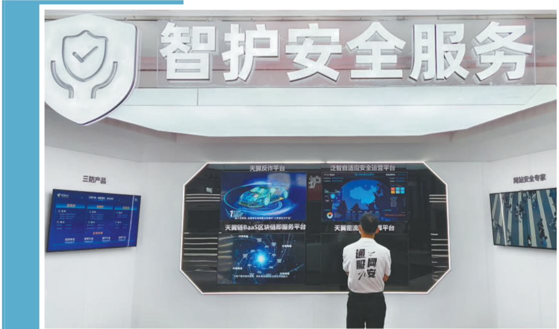
2022年国家网络安全宣传周网络安全博览会电信展台展示的智护安全服务。