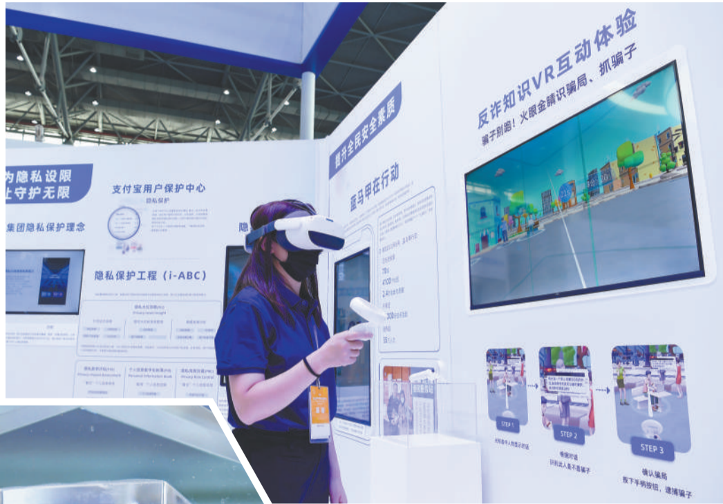
▲ 2022年国家网络安全宣传周网络安全博览会上,蚂蚁集团展台工作人员演示反诈知识VR互动体验。

“安徽这些年在数字经济、科技创新方面进展迅速,特别是在网络安全产业经济方面发展了150家左右的创新企业,成绩有目共睹。这次网络安全周开幕式在合肥举办,提高了社会民众对网络安全的认识,必将催化安徽网络安全产业更快发展。”深信服公司董事长何朝曦表示。