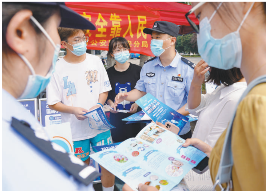
9月8日,六安市公安局裕安分局民警向皖西学院学生宣传网络安全方面的法律知识。