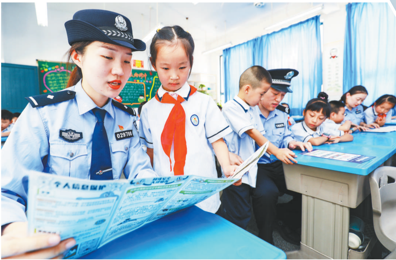
9月6日,铜陵市公安局义安分局网安大队民警向该市义安区实验小学学生讲解网络安全常识。