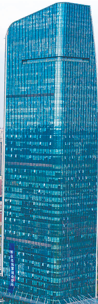
◀ 9月2日航拍的位于合肥高新区的中安创谷。

“我们的技术服务肿瘤影像和放疗、生物辐照、药物研制等多元化领域,正向成为世界高端放射技术创新引领者的目标坚实奋进。”杨义瑞自信地说。