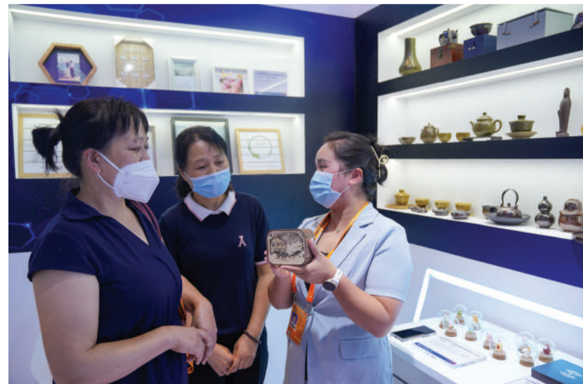
安徽馆工作人员(右一)向参观者介绍“印象徽州”木质夜灯等安徽特色文创产品。