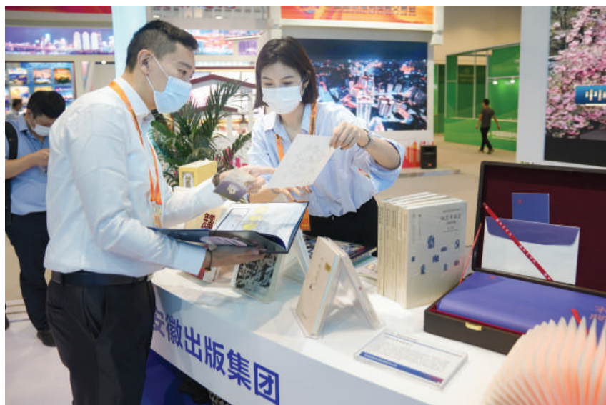
安徽出版集团带来了《觉醒年代》等系列图书。