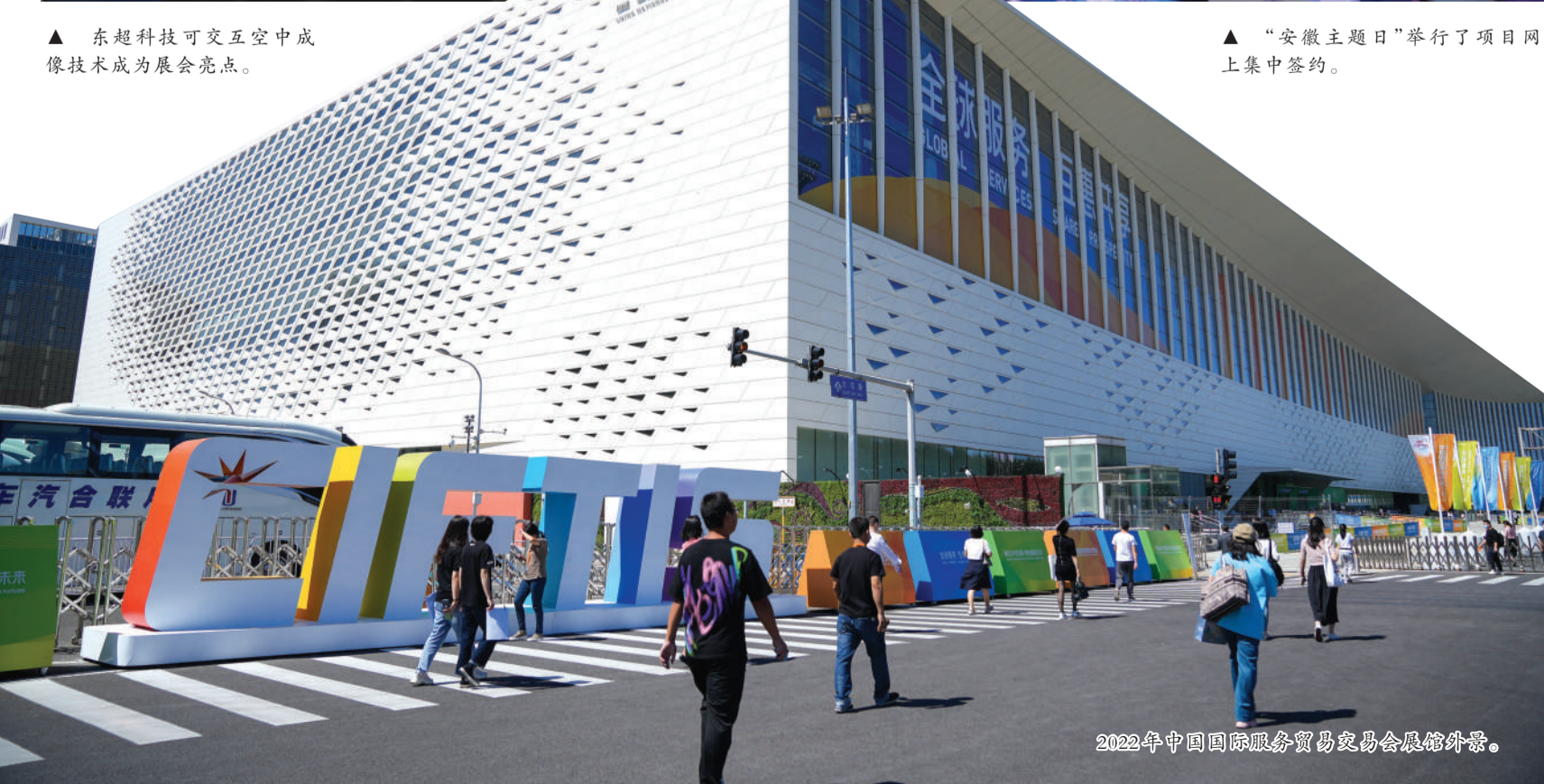
2022年中国国际服务贸易交易会展馆外景。