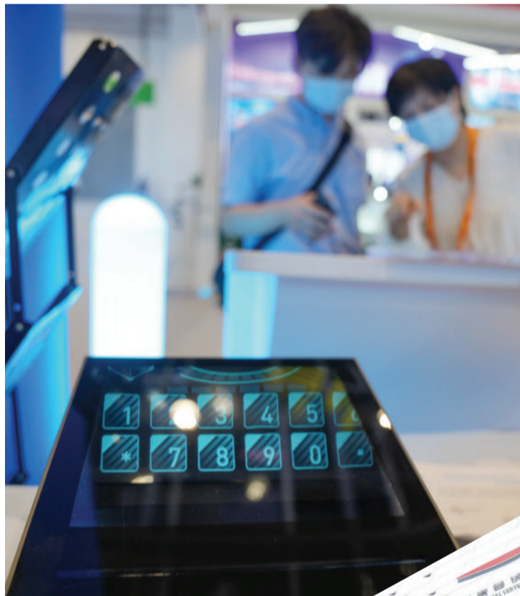
▲ 东超科技可交互空中成像技术成为展会亮点。