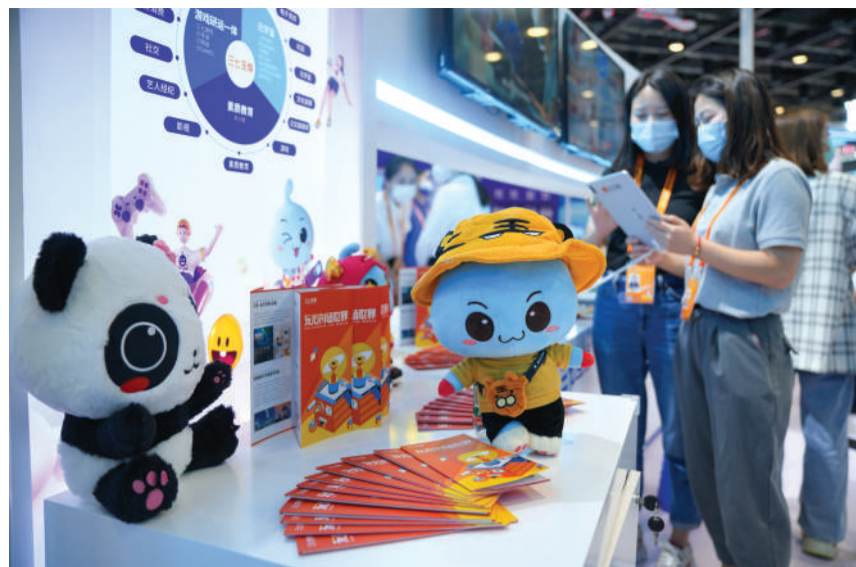
安徽动漫产品受到参观者关注。