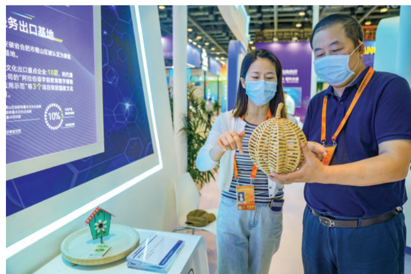
阜南县金源柳木工艺品有限公司的销售员(左)向参观者介绍柳编产品。