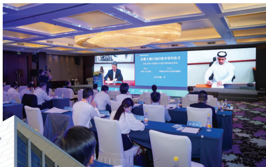
▲ “安徽主题日”举行了项目网上集中签约。